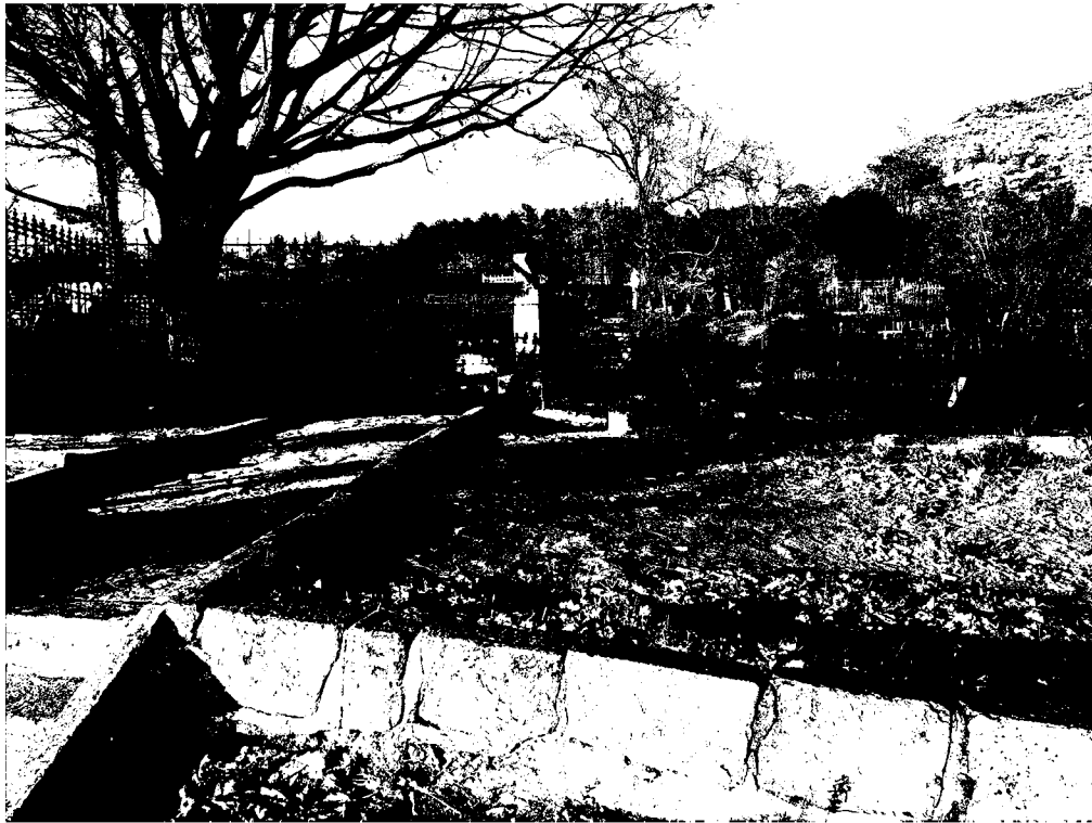
Фото 1. Объект культурного наследия регионального значения «Могила Дядьковского, выдающегося представителя русской медицины», 1841 г., Ставропольский край, г. Пятигорск, старое кладбище. Общий вид памятника.