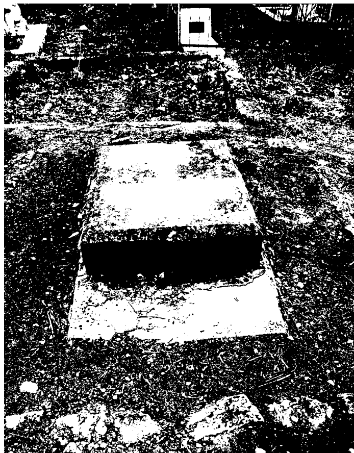
Фото 3-4. Объект культурного наследия регионального значения «Могила Дядьковского, выдающегося представителя русской медицины», 1841 г., Ставропольский край, г. Пятигорск, старое кладбище. Общий вид памятника.