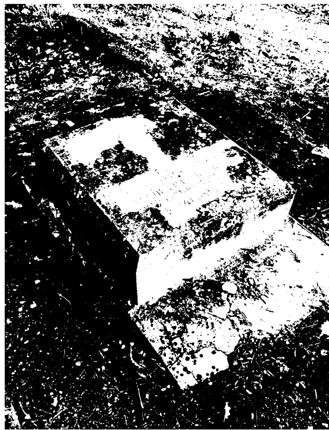
Фото 5-6. Объект культурного наследия регионального значения «Могила Дядьковского, выдающегося представителя русской медицины», 1841 г., Ставропольский край, г. Пятигорск, старое кладбище. Надгробие.