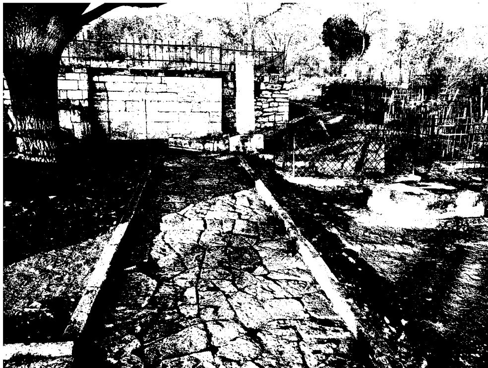
Фото 2. Объект культурного наследия регионального значения «Могила Дядьковского, выдающегося представителя русской медицины», 1841 г., Ставропольский край, г. Пятигорск, старое кладбище. Общий вид памятника.