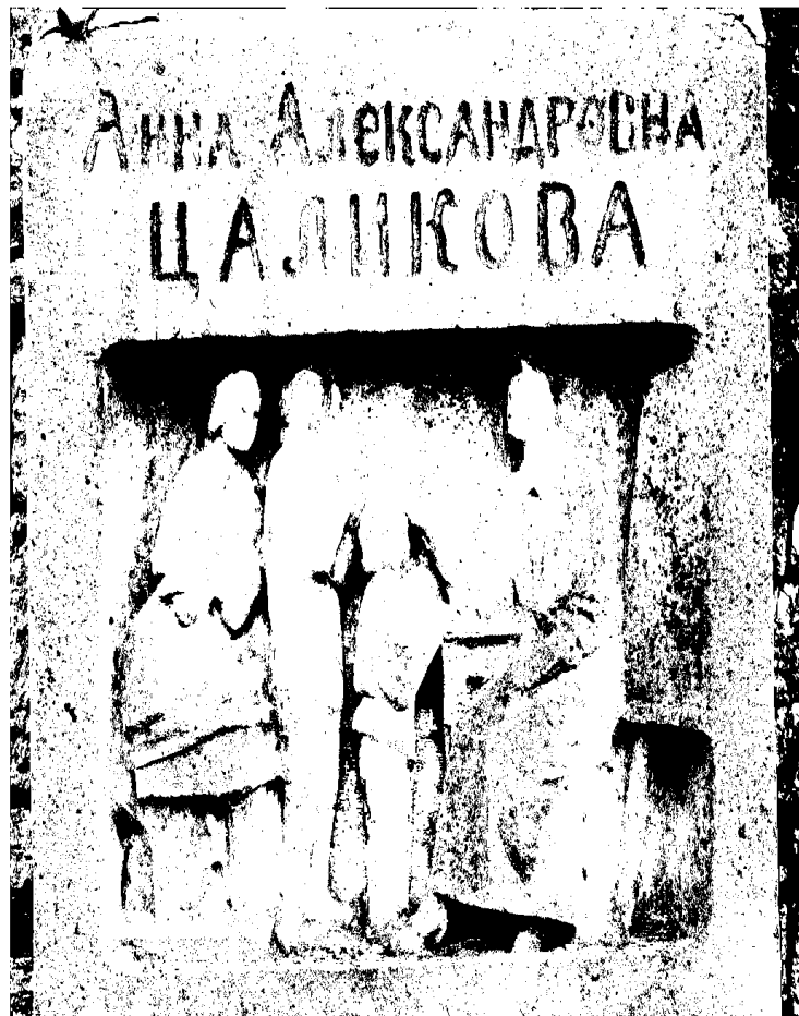
Фото 5-6. Объект культурного наследия регионального значения «Могила Цаликовой – близкого друга К. Хетагурова», Ставропольский край, г. Пятигорск, старое кладбище. Надгробная плита, горельеф.