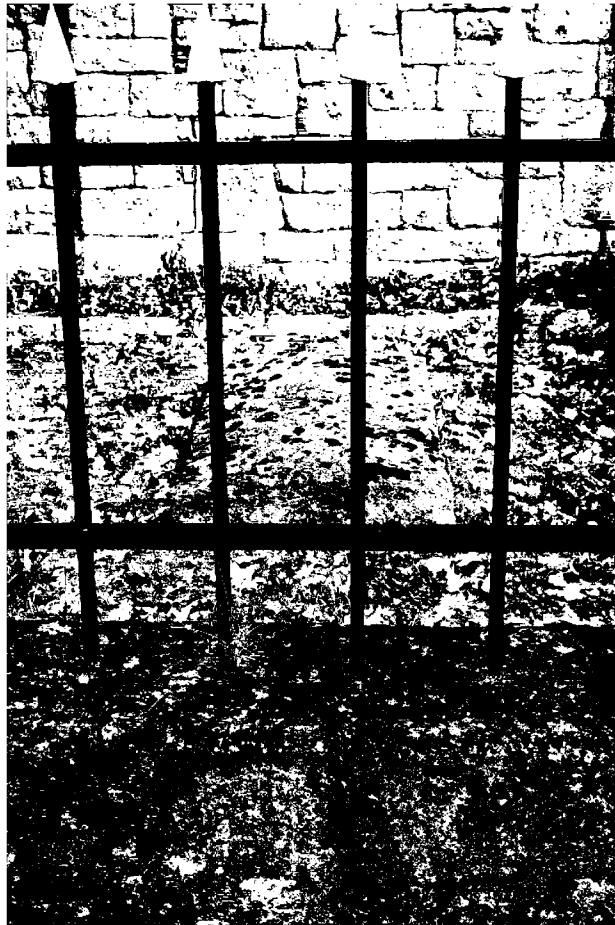
Фото 9. Объект культурного наследия регионального значения «Могила Цаликовой – близкого друга К. Хетагурова», Ставропольский край, г. Пятигорск, старое кладбище. Фрагмент металлического ограждения.