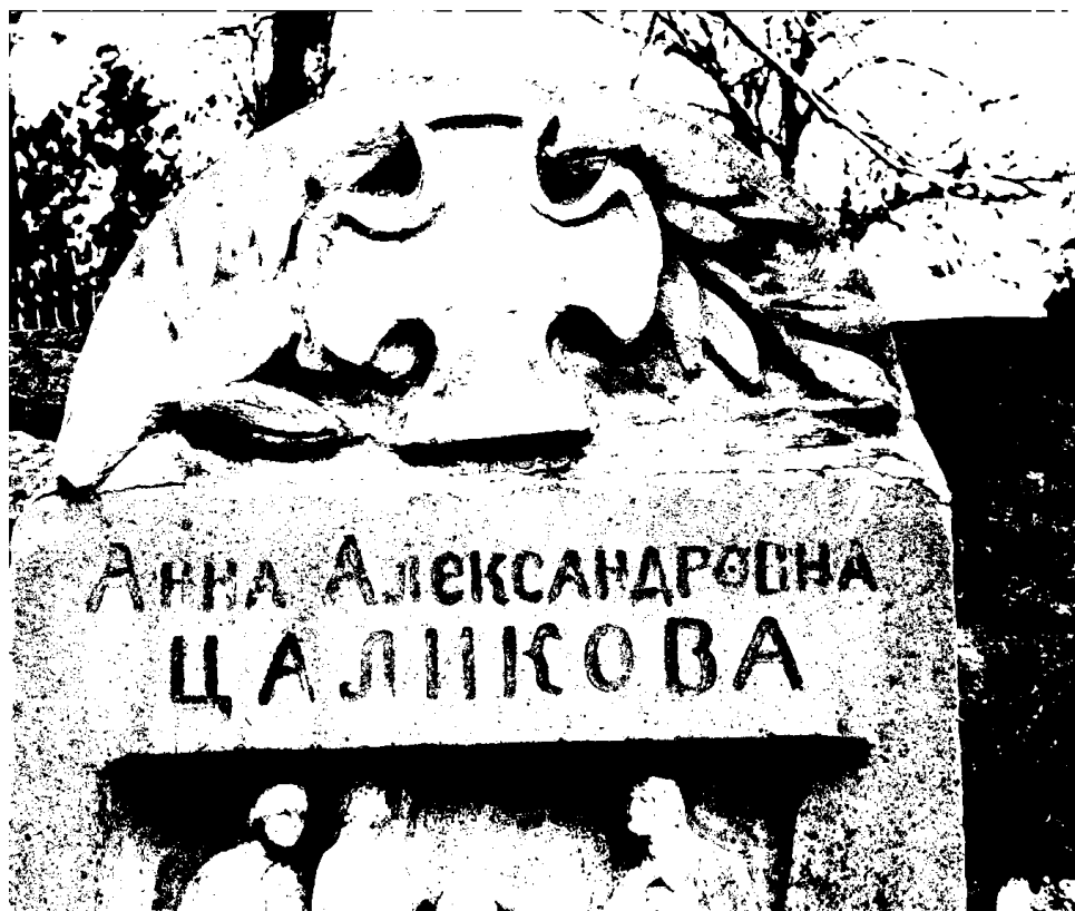
Фото 7. Объект культурного наследия регионального значения «Могила Цаликовой – близкого друга К. Хетагурова», Ставропольский край, г. Пятигорск, старое кладбище. Верх надгробной плиты.