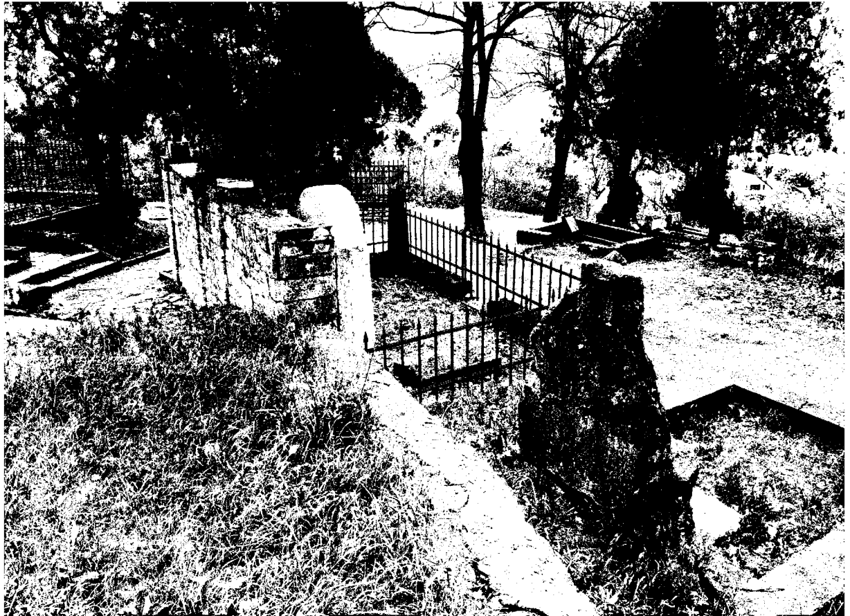
Фото 3. Объект культурного наследия регионального значения «Могила Цаликовой – близкого друга К. Хетагурова», Ставропольский край, г. Пятигорск, старое кладбище. Общий вид памятника.