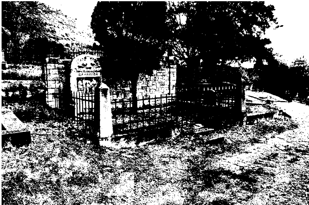
Фото 2. Объект культурного наследия регионального значения «Могила Цаликовой – близкого друга К. Хетагурова», Ставропольский край, г. Пятигорск, старое кладбище. Общий вид памятника.