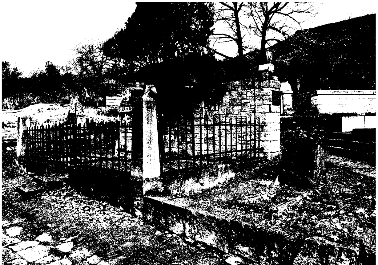
Фото 4. Объект культурного наследия регионального значения «Могила Цаликовой – близкого друга К. Хетагурова», Ставропольский край, г. Пятигорск, старое кладбище. Общий вид памятника.