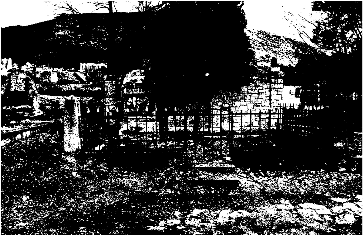
Фото 1. Объект культурного наследия регионального значения «Могила Цаликовой – близкого друга К. Хетагурова», Ставропольский край, г. Пятигорск, старое кладбище. Общий вид памятника.