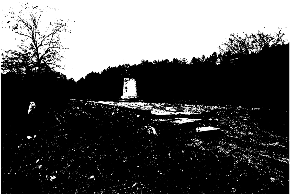
Фото 2. Объект культурного наследия регионального значения «Могила архитекторов братьев Бернардацци», 1842 г., Ставропольский край, г. Пятигорск, старое кладбище. Общий вид памятника.