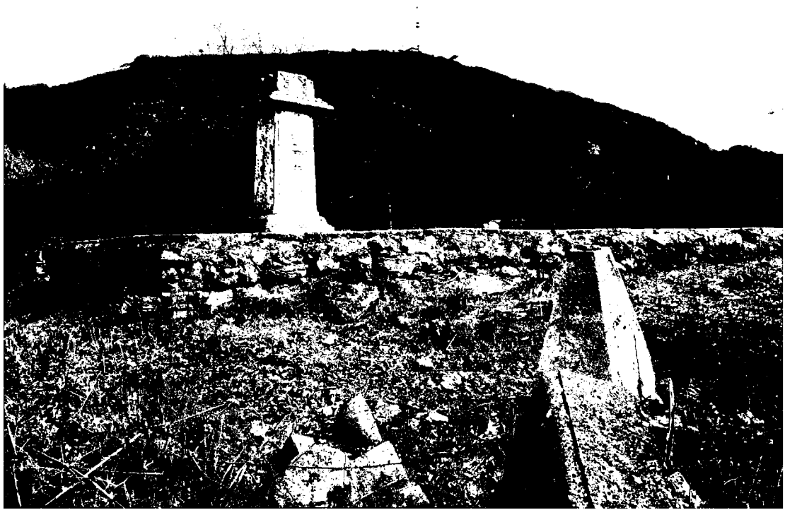
Фото 1. Объект культурного наследия регионального значения «Могила архитекторов братьев Бернардацци», 1842 г., Ставропольский край, г. Пятигорск, старое кладбище. Общий вид памятника.