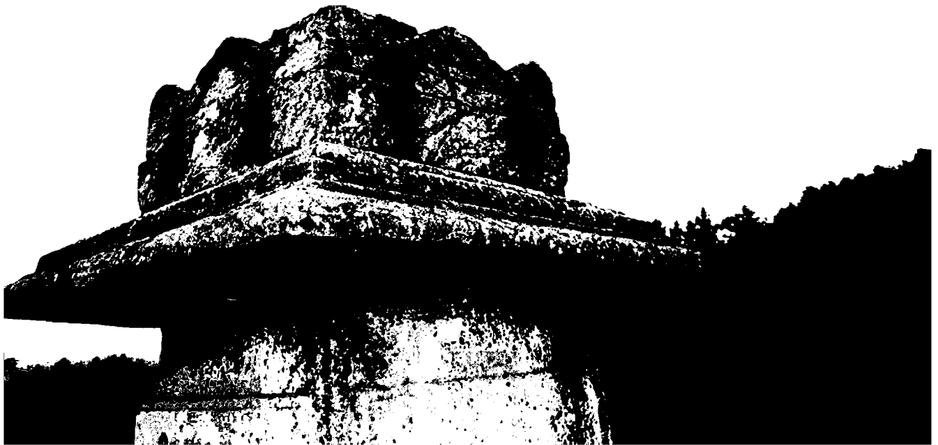
Фото 5. Объект культурного наследия регионального значения «Могила архитекторов братьев Бернардацци», 1842 г., Ставропольский край, г. Пятигорск, старое кладбище. Козырек постамента.