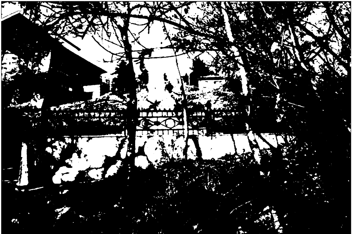
Фото 4. Объект культурного наследия регионального значения «Обелиск А.В. Пастухову», 1900 г., Ставропольский край, г. Пятигорск, на вершине горы Машук. Общий вид памятника с юга.