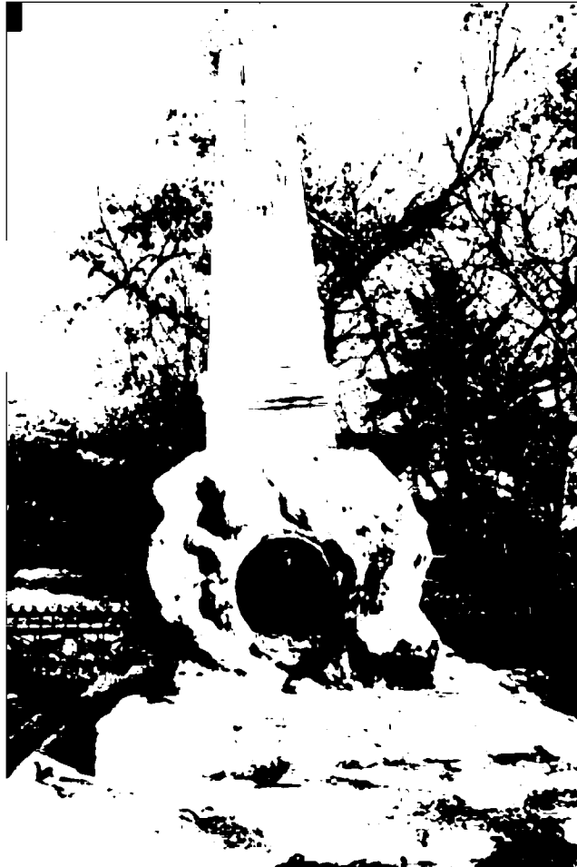
Фото 6. Объект культурного наследия регионального значения «Обелиск А.В. Пастухову», 1900 г., Ставропольский край, г. Пятигорск, на вершине горы Машук. Обелиск, вид с запада.