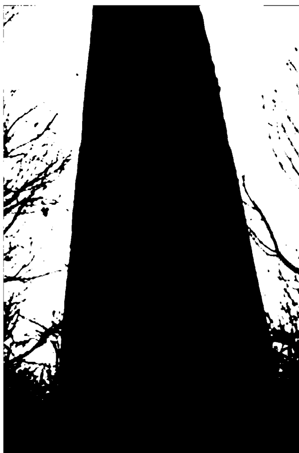
Фото 8-10. Объект культурного наследия регионального значения «Обелиск А.В. Пастухову», 1900 г., Ставропольский край, г. Пятигорск, на вершине горы Машук. Надписи на обелиске.