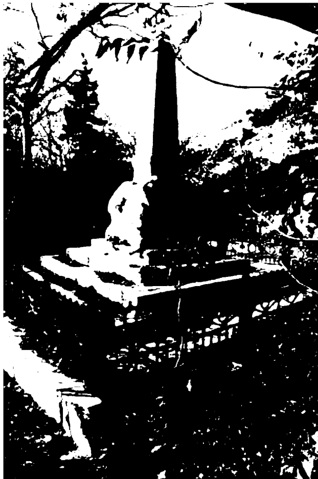
Фото 5. Объект культурного наследия регионального значения «Обелиск А.В. Пастухову», 1900 г., Ставропольский край, г. Пятигорск, на вершине горы Машук. Общий вид памятника с юго-востока.