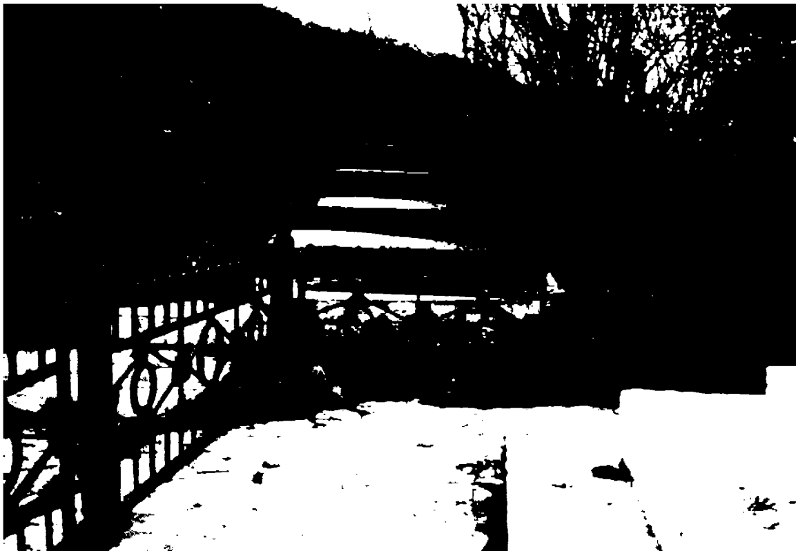
Фото 12-13. Объект культурного наследия регионального значения «Обелиск А.В. Пастухову», 1900 г., Ставропольский край, г. Пятигорск, на вершине горы Машук. Чугунное ограждение памятника.