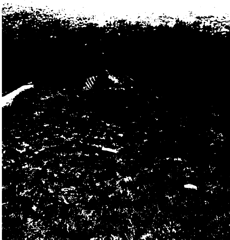
Фото 1. Объект культурного наследия регионального значения «Обелиск А.В. Пастухову», 1900 г., Ставропольский край, г. Пятигорск, на вершине горы Машук. Общий вид памятника.