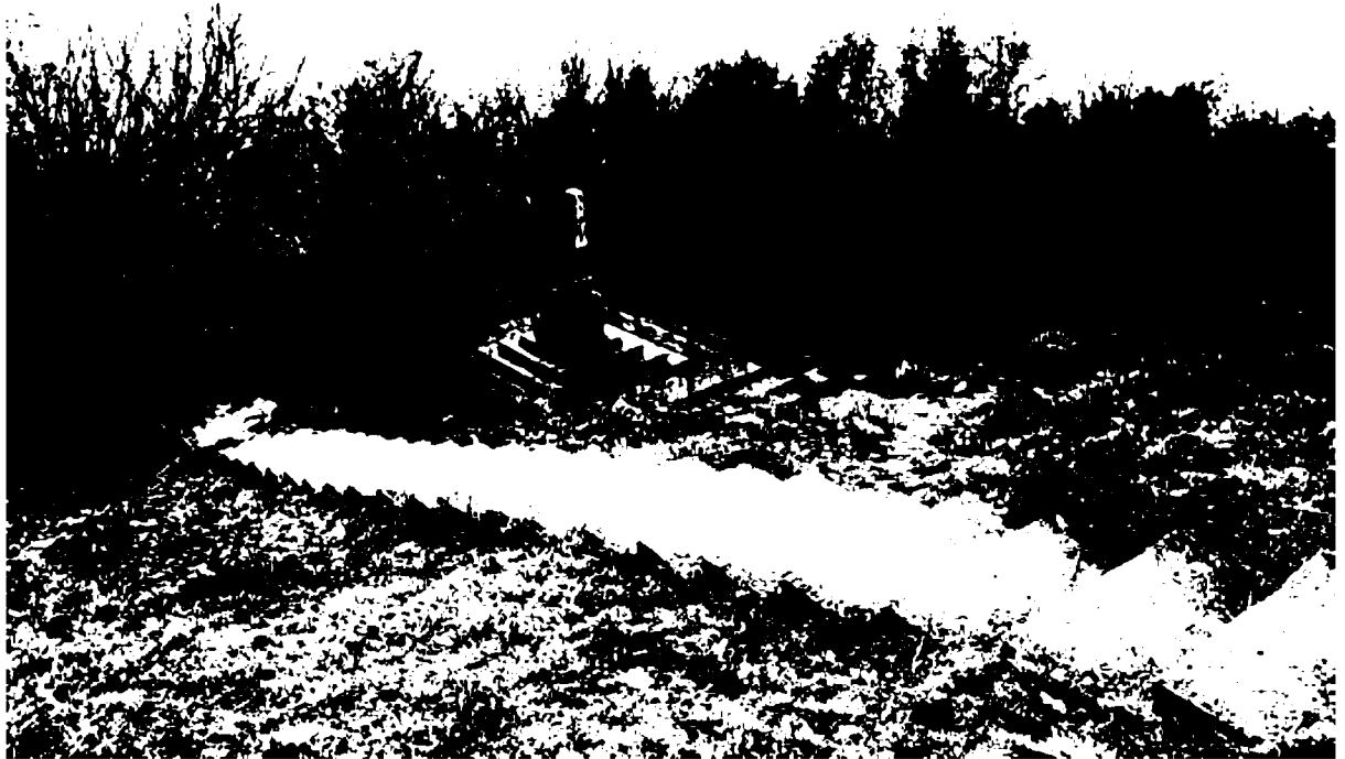
Фото 2. Объект культурного наследия регионального значения «Обелиск А.В. Пастухову», 1900 г., Ставропольский край, г. Пятигорск, на вершине горы Машук. Общий вид памятника с северо-востока.