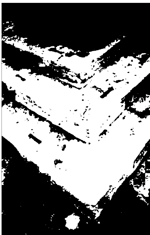
Фото 11. Объект культурного наследия регионального значения «Обелиск А.В. Пастухову», 1900 г., Ставропольский край, г. Пятигорск, на вершине горы Машук. Фрагмент ступенчатого основания обелиска.