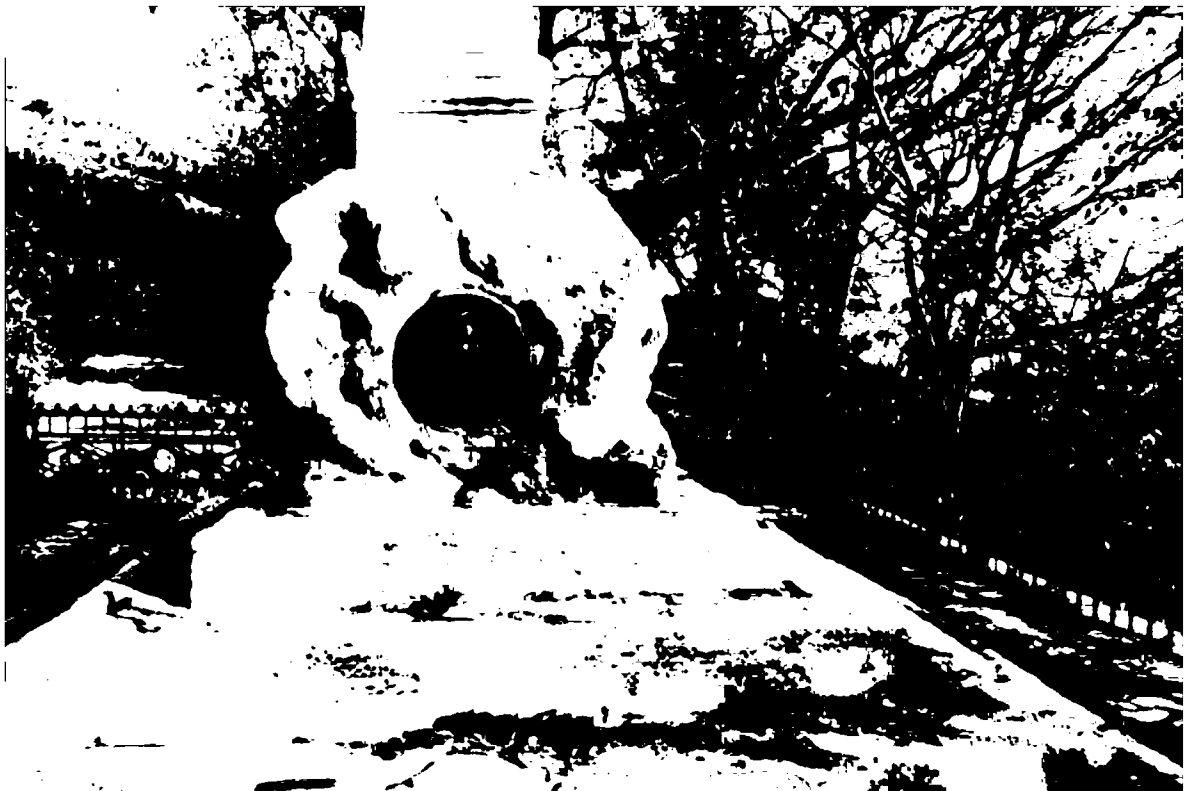
Фото 7. Объект культурного наследия регионального значения «Обелиск А.В. Пастухову», 1900 г., Ставропольский край, г. Пятигорск, на вершине горы Машук. База обелиска с бронзовым барельефом.