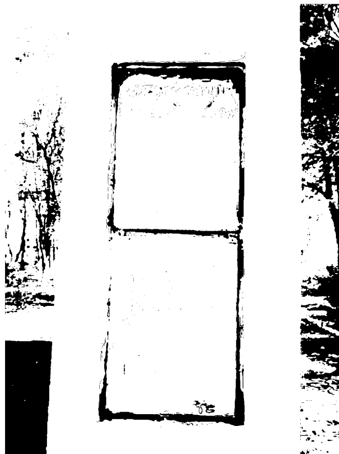
Фото 13. Объект культурного наследия регионального значения «Памятник «Комсомолия – Родина помнит», 1968 г., Ставропольский край, г. Пятигорск, пос. Горячеводский, ул. Ленина, 61. Мемориальные доски на торцевой части мемориальной стены.