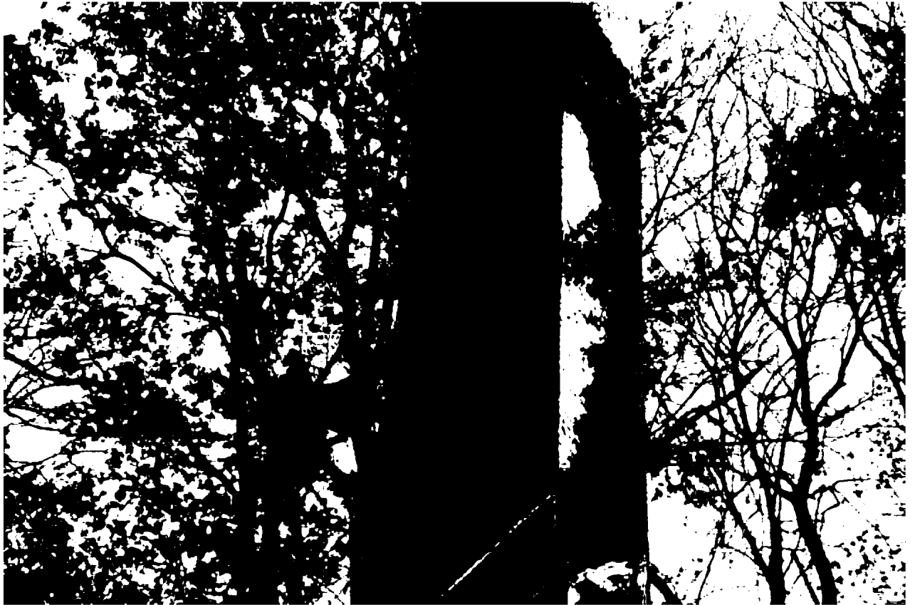
Фото 10. Объект культурного наследия регионального значения «Памятник «Комсомолия – Родина помнит», 1968 г., Ставропольский край, г. Пятигорск, пос. Горячеводский, ул. Ленина, 61. Часть стелы: пятиконечная звезда, значок комсомола.