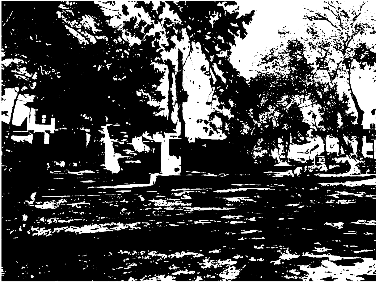
Фото 2. Объект культурного наследия регионального значения «Памятник «Комсомолия – Родина помнит», 1968 г., Ставропольский край, г. Пятигорск, пос. Горячеводский, ул. Ленина, 61. Общий вид памятника.