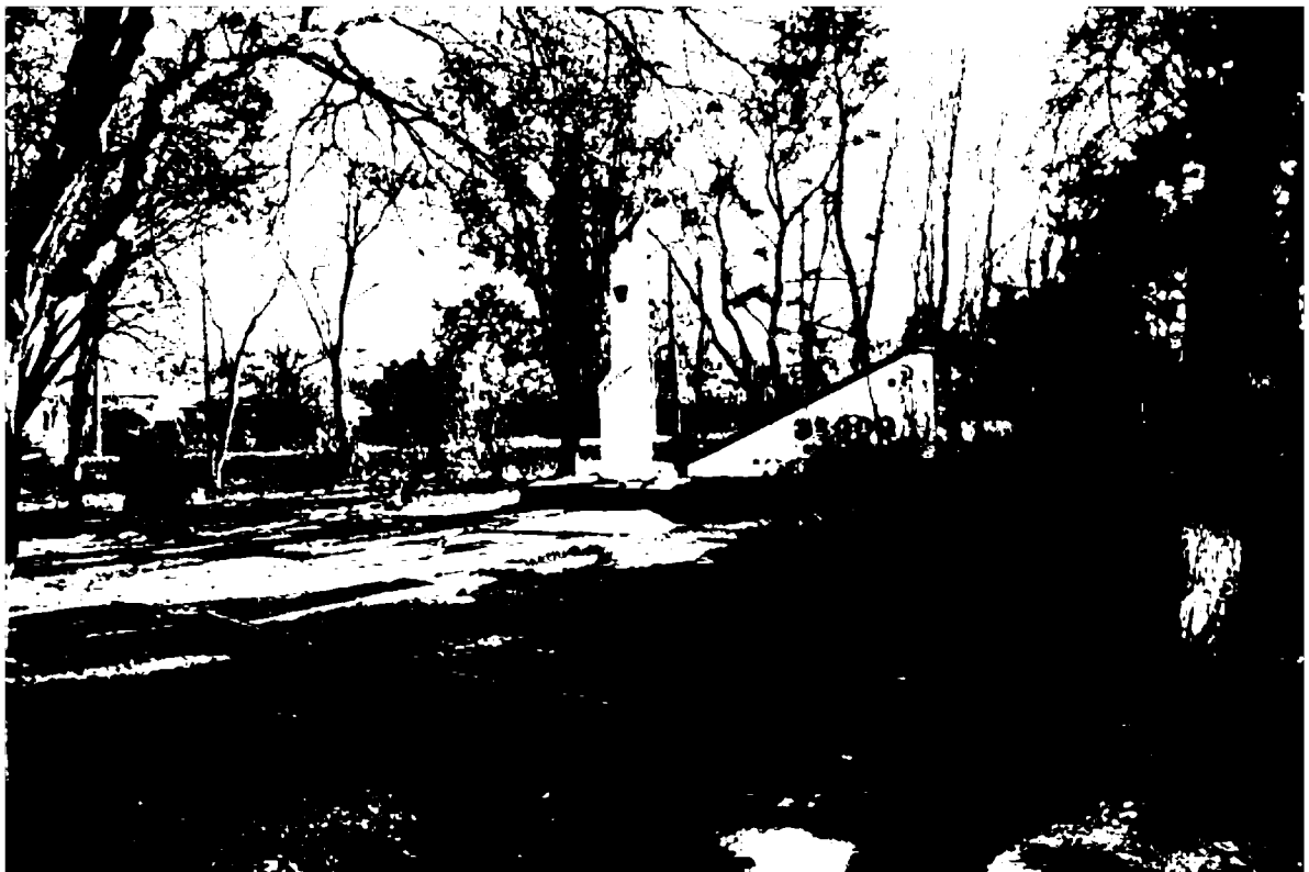
Фото 3. Объект культурного наследия регионального значения «Памятник «Комсомолия – Родина помнит», 1968 г., Ставропольский край, г. Пятигорск, пос. Горячеводский, ул. Ленина, 61. Общий вид памятника.