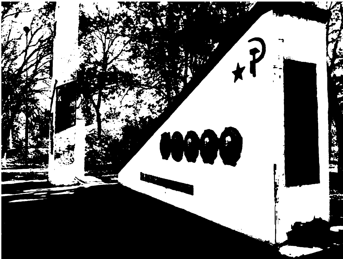
Фото 4. Объект культурного наследия регионального значения «Памятник «Комсомолия – Родина помнит», 1968 г., Ставропольский край, г. Пятигорск, пос. Горячеводский, ул. Ленина, 61. Мемориальная стена и часть стелы.