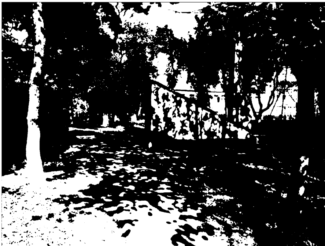
Фото 5. Объект культурного наследия регионального значения «Памятник «Комсомолия – Родина помнит», 1968 г., Ставропольский край, г. Пятигорск, пос. Горячеводский, ул. Ленина, 61. Мемориальная стена.