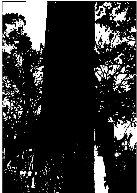
Фото 6-9. Объект культурного наследия регионального значения «Памятник «Комсомолия – Родина помнит», 1968 г., Ставропольский край, г. Пятигорск, пос. Горячеводский, ул. Ленина, 61. Стела: общий вид, мемориальные доски.