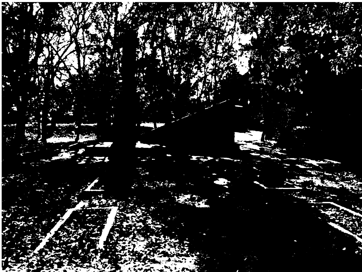
Фото 1. Объект культурного наследия регионального значения «Памятник «Комсомолия – Родина помнит», 1968 г., Ставропольский край, г. Пятигорск, пос. Горячеводский, ул. Ленина, 61. Общий вид памятника.