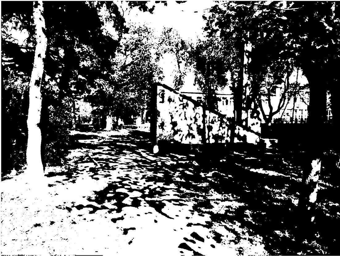
Фото 11-12. Объект культурного наследия регионального значения «Памятник «Комсомолия – Родина помнит», 1968 г., Ставропольский край, г. Пятигорск, пос. Горячеводский, ул. Ленина, 61. Мемориальная стена.