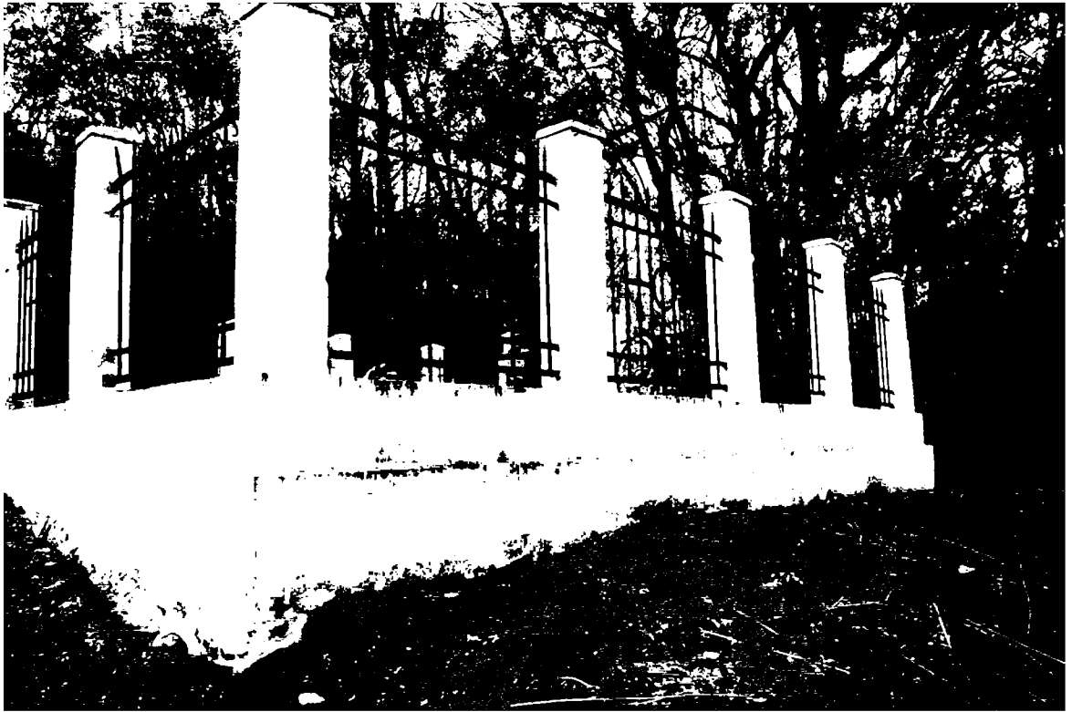
Фото 7. Объект культурного наследия регионального значения «Братская могила жертв фашистского террора», 1943 г., расположенного по адресу: Ставропольский край, г. Пятигорск, в 1 км от Провала. Фрагмент ограждения.