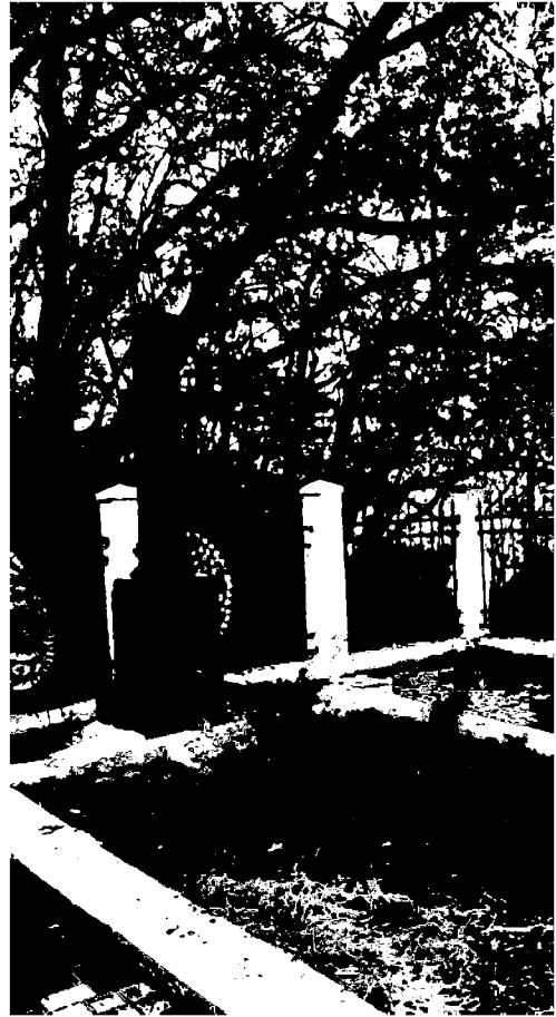
Фото 4-5. Объект культурного наследия регионального значения «Братская могила жертв фашистского террора», 1943 г., расположенного по адресу: Ставропольский край, г. Пятигорск, в 1 км от Провала. Общий вид памятника.