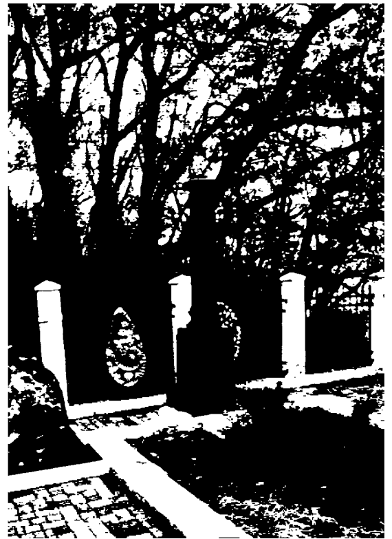
Фото 2-3. Объект культурного наследия регионального значения «Братская могила жертв фашистского террора», 1943 г., расположенного по адресу: Ставропольский край, г. Пятигорск, в 1 км от Провала.