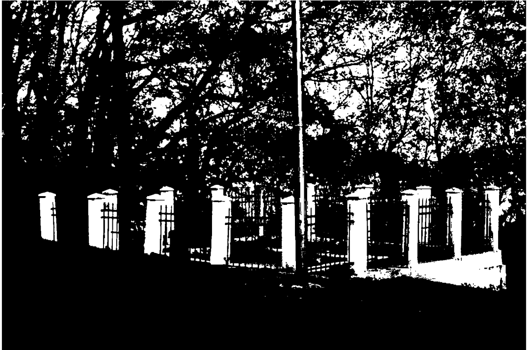
Фото 1. Объект культурного наследия регионального значения «Братская могила жертв фашистского террора», 1943 г., Ставропольский край, г. Пятигорск, в 1 км от Провала.