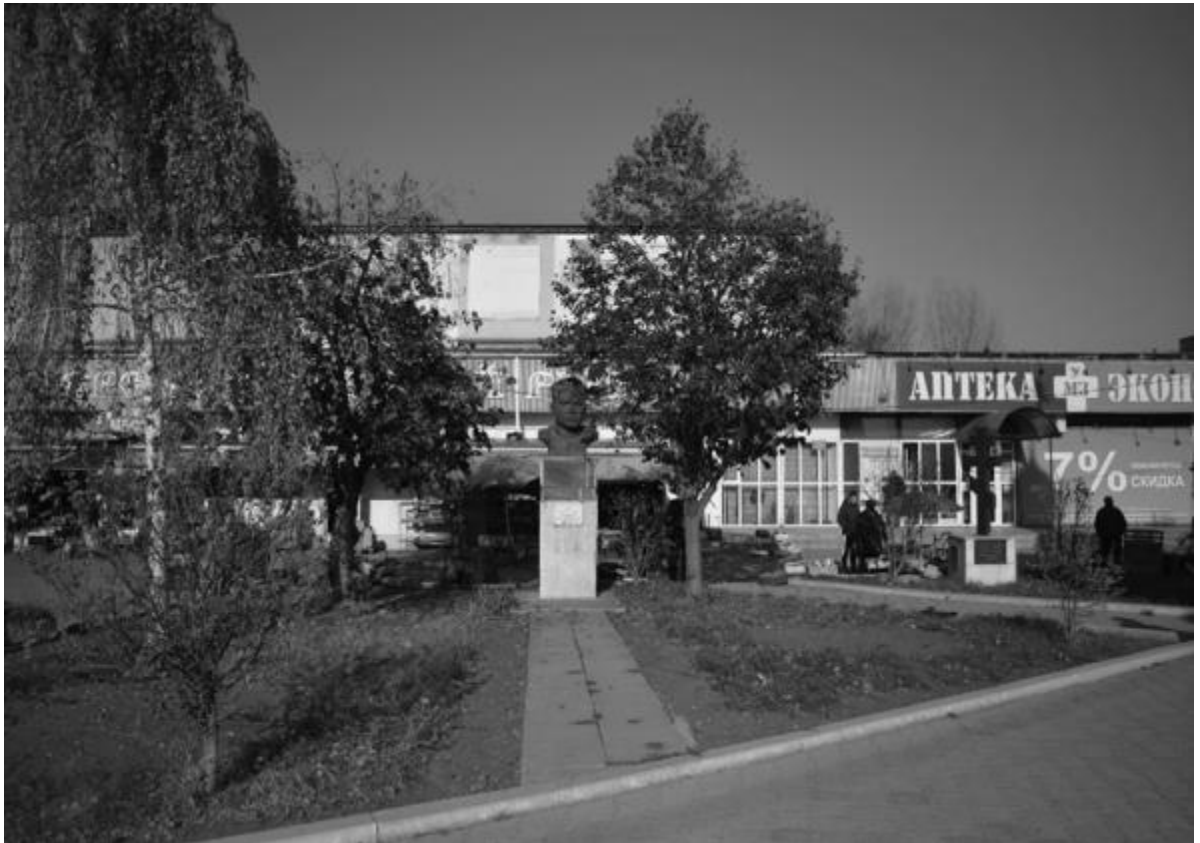
Фото 2. Объект культурного наследия регионального значения «Памятник генералу Козлову П.М. – Герою Советского Союза», 1957 г., Ставропольский край, г. Пятигорск, пр. Калинина, п. Горячеводский. Общий вид памятника.