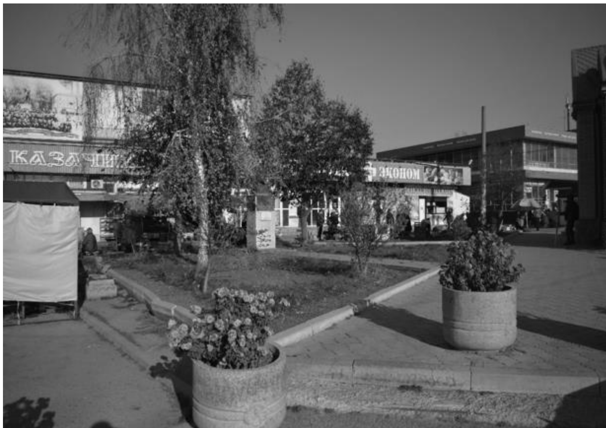
Фото 1. Объект культурного наследия регионального значения «Памятник генералу Козлову П.М. – Герою Советского Союза», 1957 г., Ставропольский край, г. Пятигорск, пр. Калинина, п. Горячеводский. Общий вид памятника.