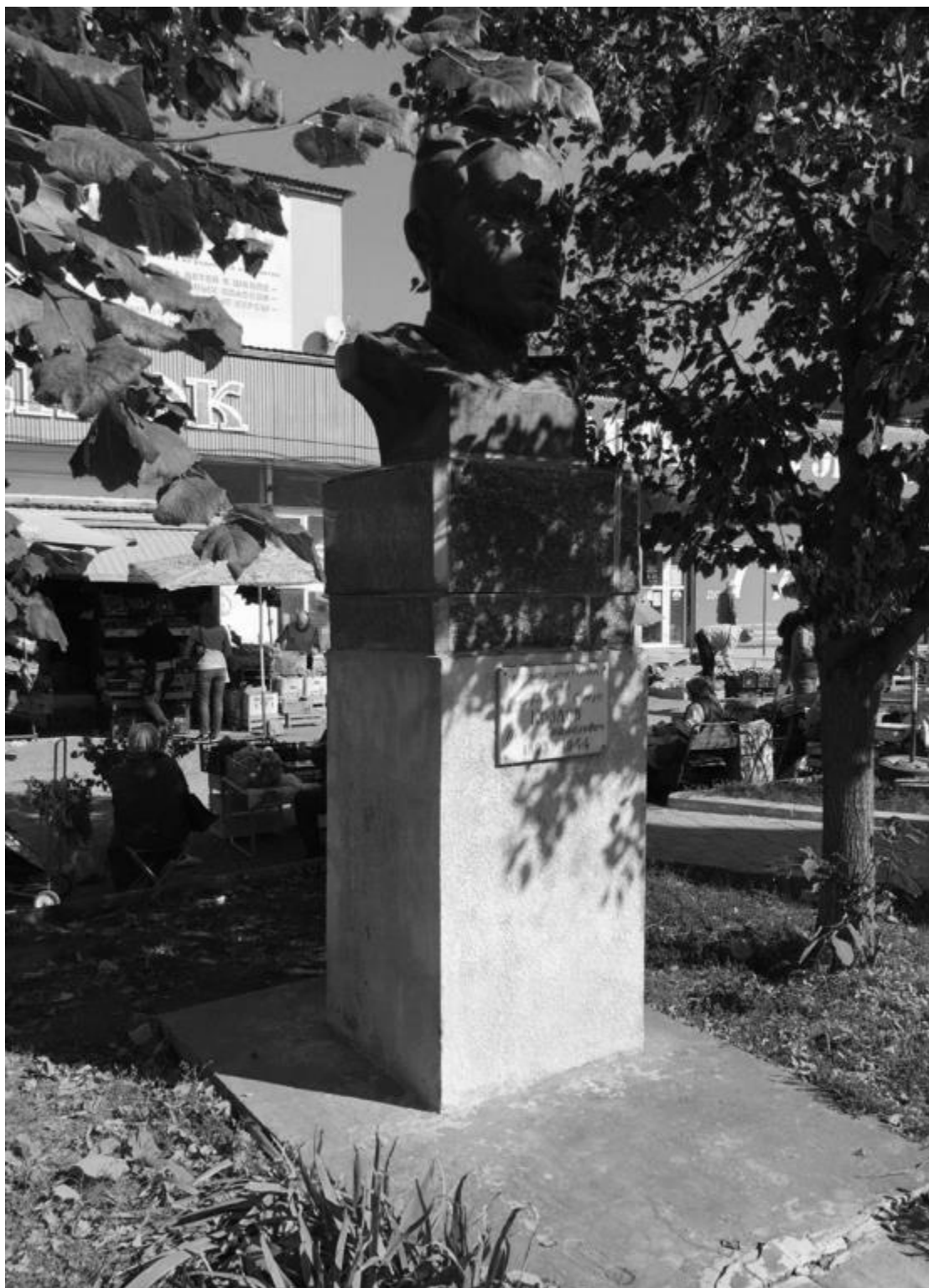
Фото 4. Объект культурного наследия регионального значения «Памятник генералу Козлову П.М. – Герою Советского Союза», 1957 г., Ставропольский край, г. Пятигорск, пр. Калинина, п. Горячеводский. Бюст, постамент.