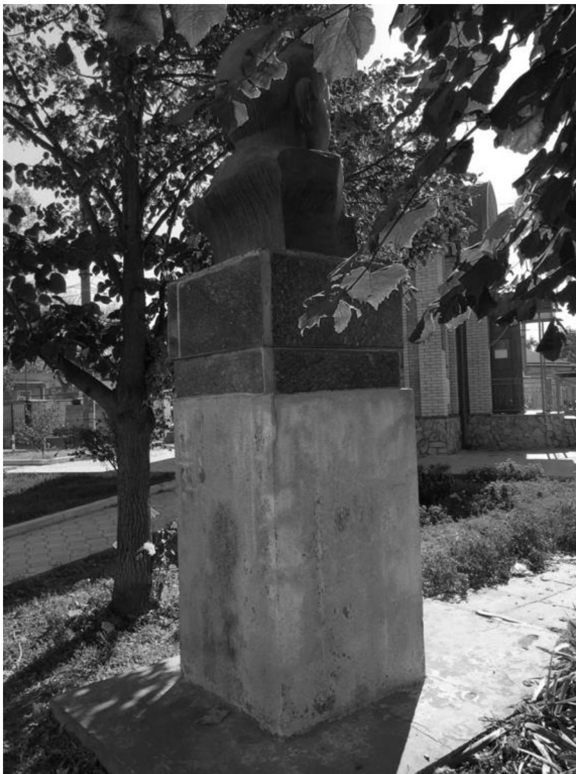
Фото 5. Объект культурного наследия регионального значения «Памятник не вернувшимся с войны», 1967 г., Ставропольский край, г. Пятигорск, пос. Горячеводский, ул. Ленина 25. Вид памятника с северо-запада..