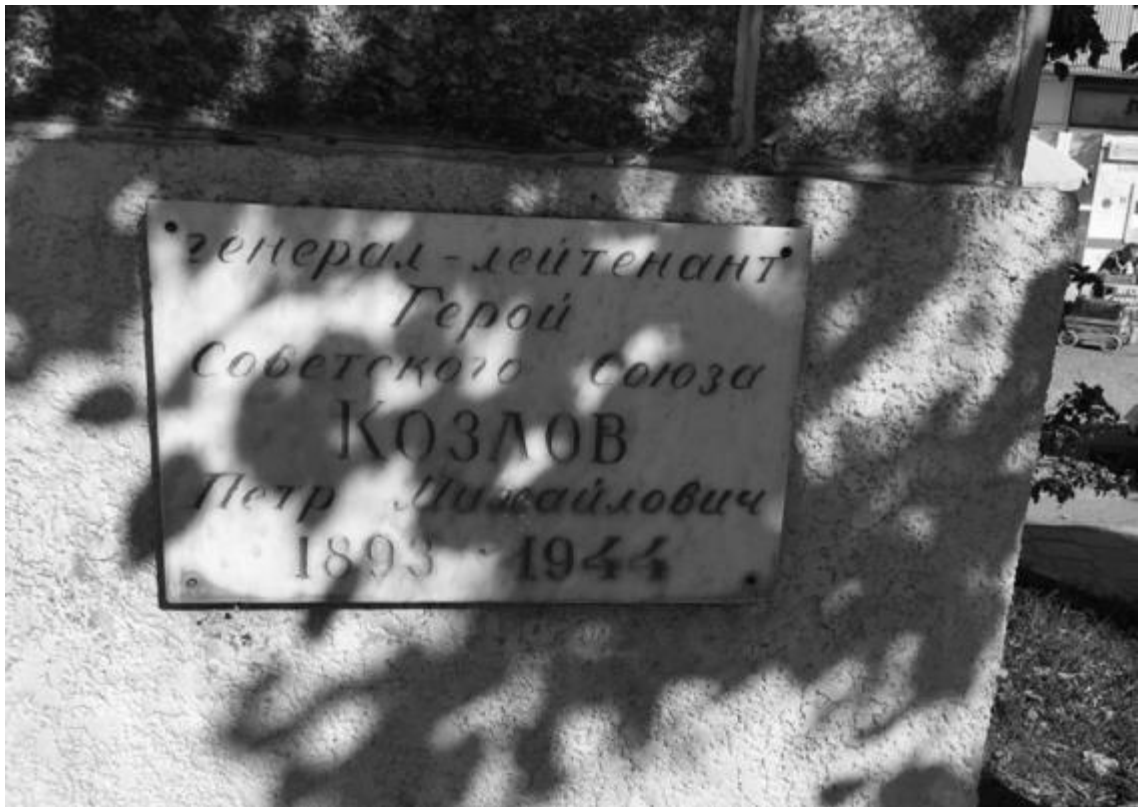
Фото 3. Объект культурного наследия регионального значения «Памятник генералу Козлову П.М. – Герою Советского Союза», 1957 г., Ставропольский край, г. Пятигорск, пр. Калинина, п. Горячеводский. Мемориальная доска.