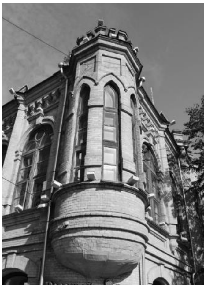
Фото 6. Объект культурного наследия регионального значения «Здание детской художественной школы, в котором в 1918 году выступал с докладом С.М. Киров», 1896 г., Ставропольский край, г. Пятигорск, пр. Кирова, 68. Угловой эркер.