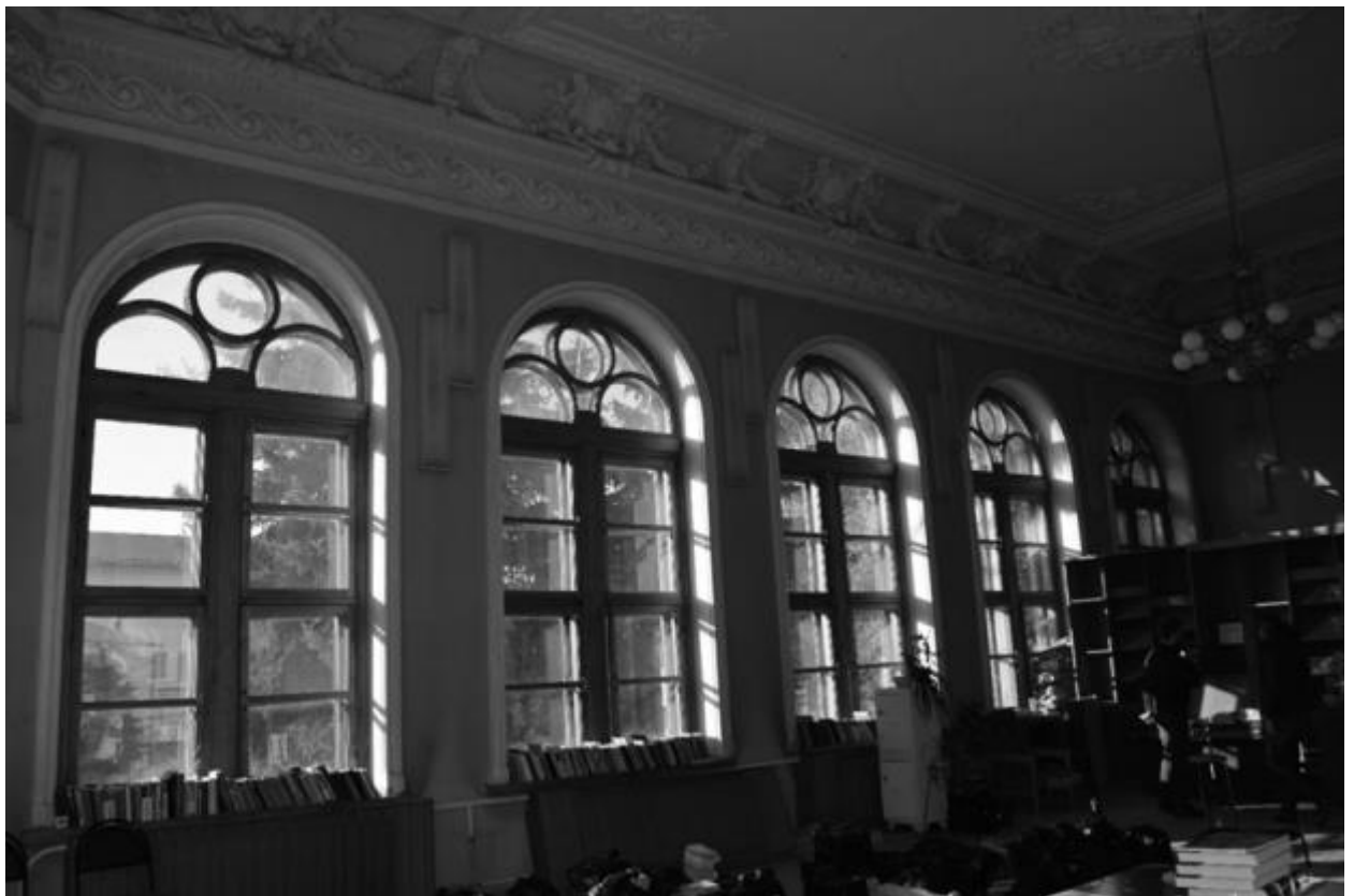
Фото 24. Объект культурного наследия регионального значения «Здание детской художественной школы, в котором в 1918 году выступал с докладом С.М. Киров», 1896 г., Ставропольский край, г. Пятигорск, пр. Кирова, 68. Окна второго этажа.