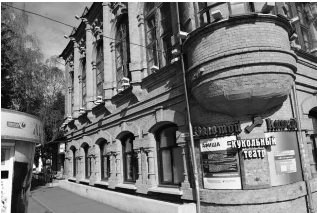
Фото 8. Объект культурного наследия регионального значения «Здание детской художественной школы, в котором в 1918 году выступал с докладом С.М. Киров», 1896 г., Ставропольский край, г. Пятигорск, пр. Кирова, 68. Западный фасад.