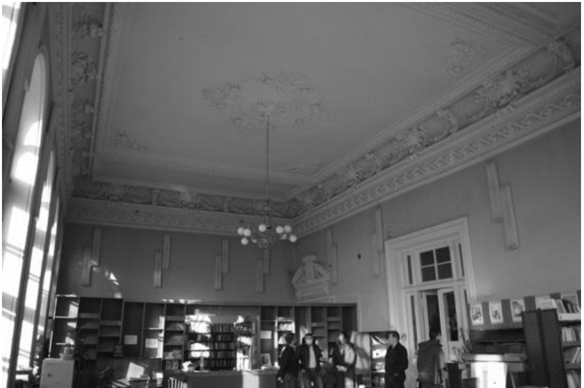
Фото 19-23. Объект культурного наследия регионального значения «Здание детской художественной школы, в котором в 1918 году выступал с докладом С.М. Киров», 1896 г., Ставропольский край, г. Пятигорск, пр. Кирова, 68. Декоративное оформление интерьера (помещение № 51).