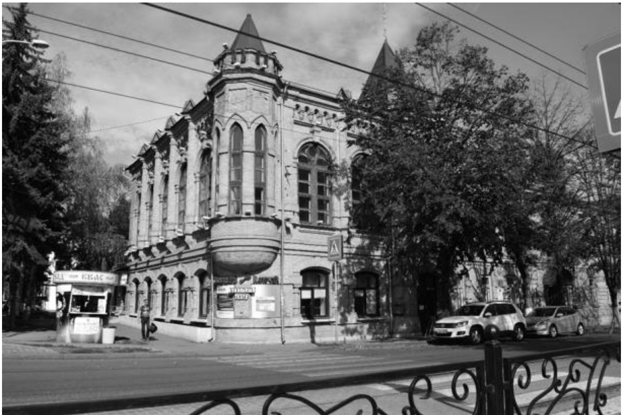
Фото 2. Объект культурного наследия регионального значения «Здание детской художественной школы, в котором в 1918 году выступал с докладом С.М. Киров», 1896 г., Ставропольский край, г. Пятигорск, пр. Кирова, 68. Общий вид памятника.