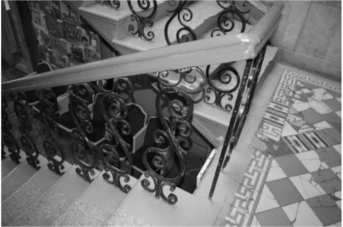
Фото 15-16. Объект культурного наследия регионального значения «Здание детской художественной школы, в котором в 1918 году выступал с докладом С.М. Киров», 1896 г., Ставропольский край, г. Пятигорск, пр. Кирова, 68. Межэтажная лестница, лестничное ограждение.