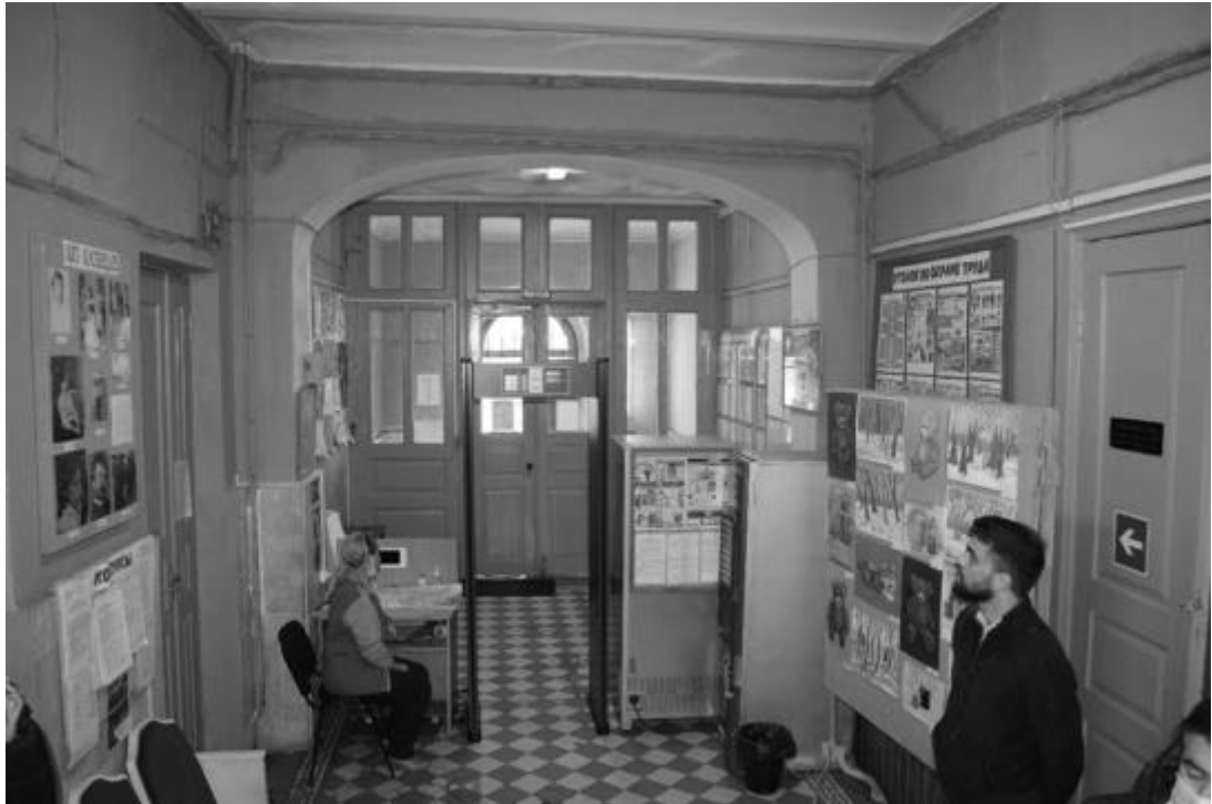
Фото 14. Объект культурного наследия регионального значения «Здание детской художественной школы, в котором в 1918 году выступал с докладом С.М. Киров», 1896 г., Ставропольский край, г. Пятигорск, пр. Кирова, 68. Фрагмент интерьера первого этажа.