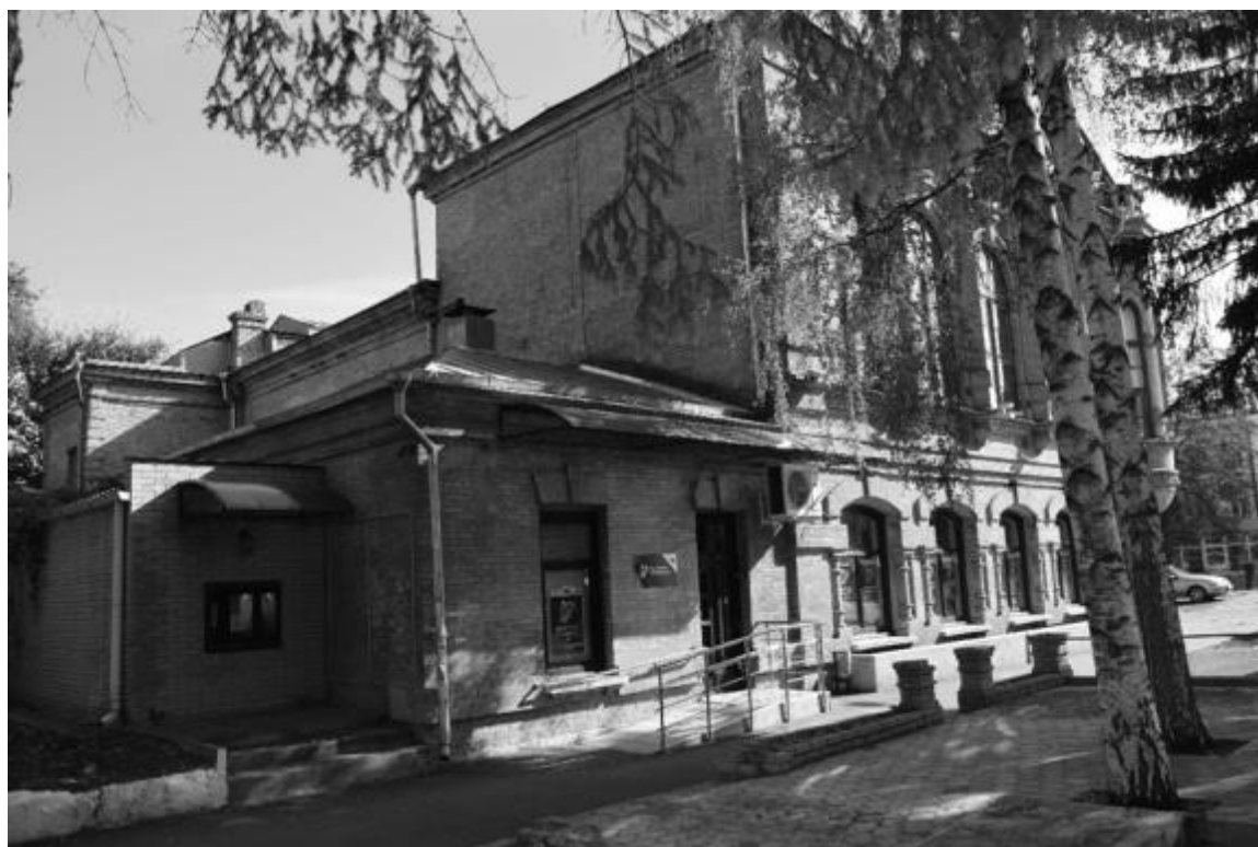
Фото 7. Объект культурного наследия регионального значения «Здание детской художественной школы, в котором в 1918 году выступал с докладом С.М. Киров», 1896 г., Ставропольский край, г. Пятигорск, пр. Кирова, 68. Общий вид памятника с запада.