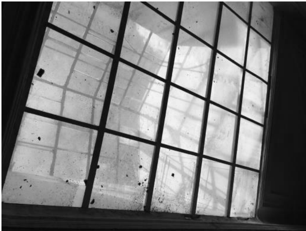
Фото 27. Объект культурного наследия регионального значения «Здание детской художественной школы, в котором в 1918 году выступал с докладом С.М. Киров», 1896 г., Ставропольский край, г. Пятигорск, пр. Кирова, 68. Световой фонарь.