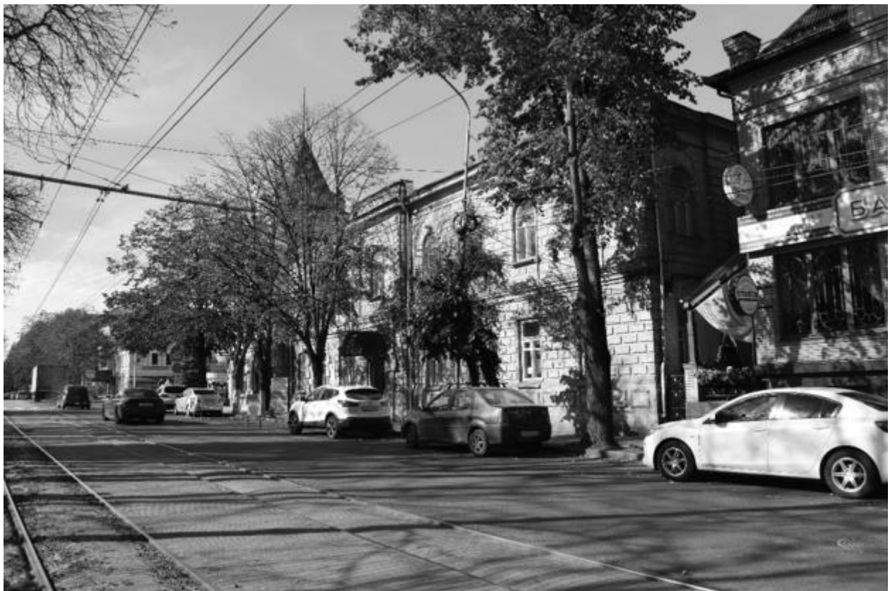
Фото 3. Объект культурного наследия регионального значения «Здание детской художественной школы, в котором в 1918 году выступал с докладом С.М. Киров», 1896 г., Ставропольский край, г. Пятигорск, пр. Кирова, 68. Общий вид памятника.