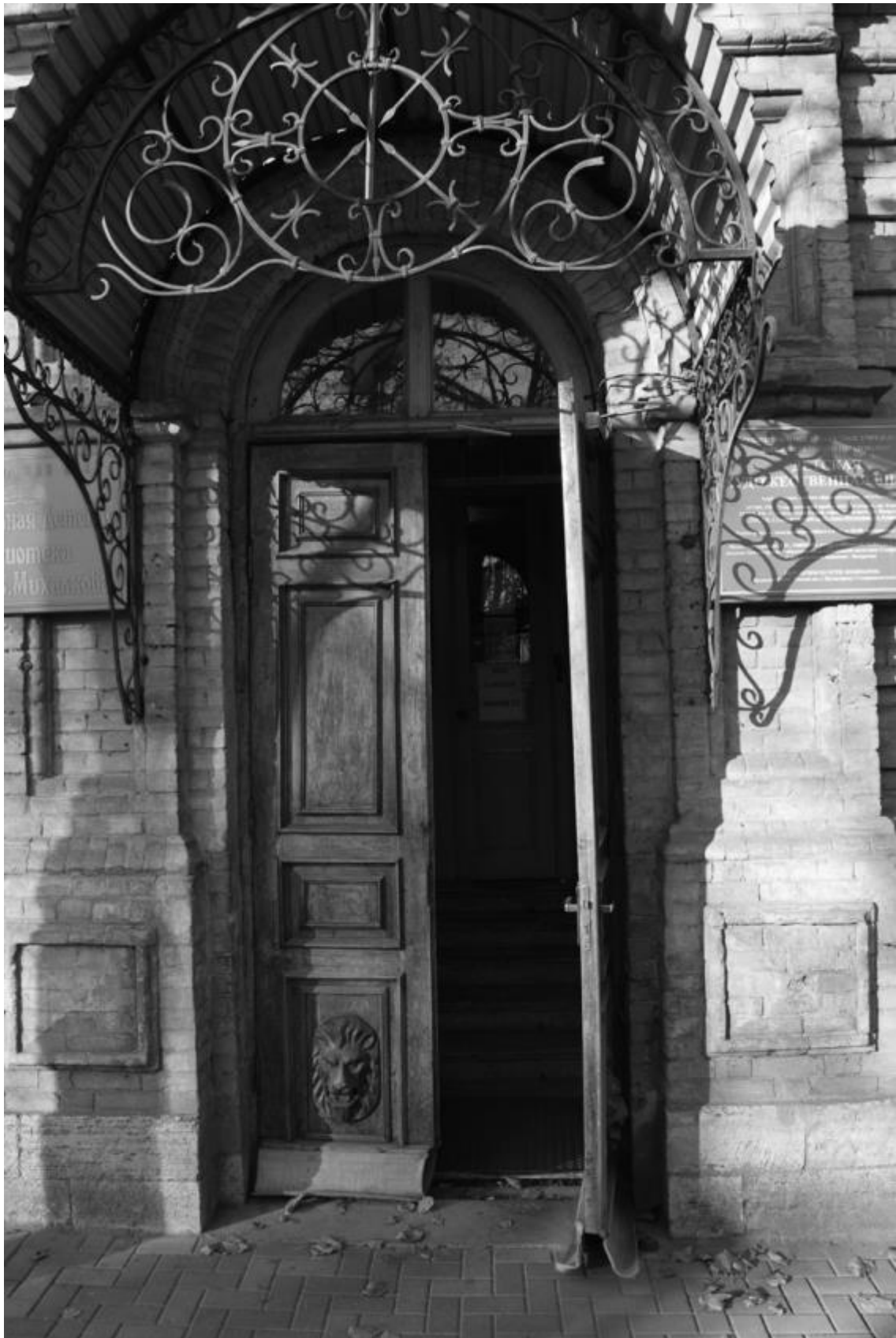
Фото 11. Объект культурного наследия регионального значения «Здание детской художественной школы, в котором в 1918 году выступал с докладом С.М. Киров», 1896 г., Ставропольский край, г. Пятигорск, пр. Кирова, 68. Вход на главном фасаде.