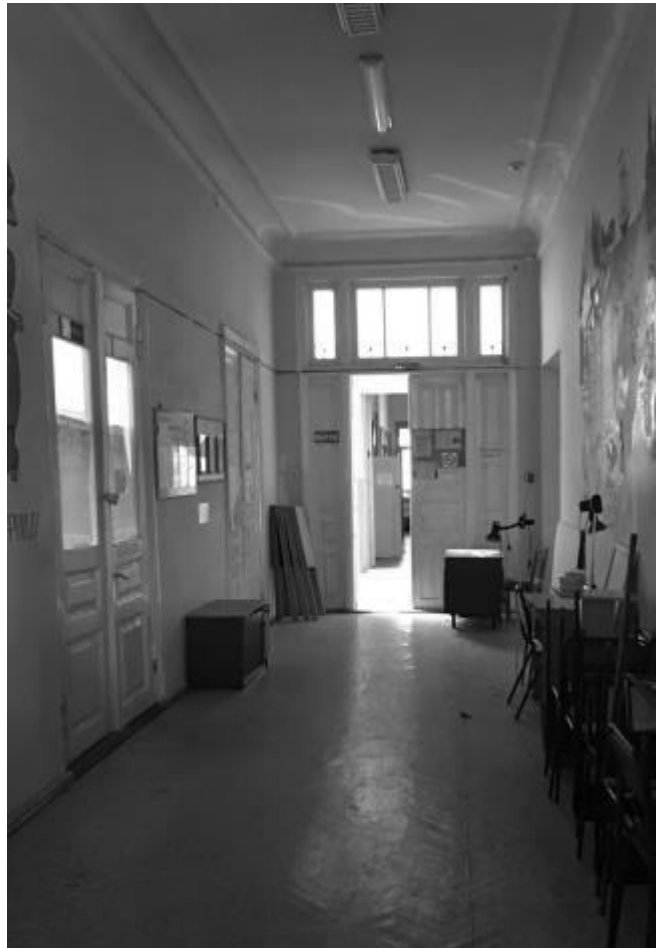
Фото 25-26. Объект культурного наследия регионального значения «Здание детской художественной школы, в котором в 1918 году выступал с докладом С.М. Киров», 1896 г., Ставропольский край, г. Пятигорск, пр. Кирова, 68. Внутренние двери.