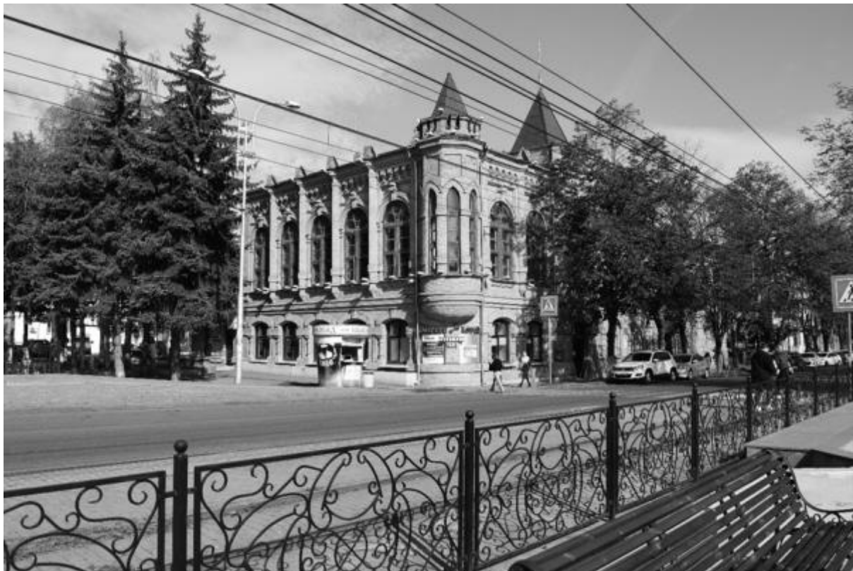
Фото 1. Объект культурного наследия регионального значения «Здание детской художественной школы, в котором в 1918 году выступал с докладом С.М. Киров», 1896 г., Ставропольский край, г. Пятигорск, пр. Кирова, 68. Общий вид памятника.