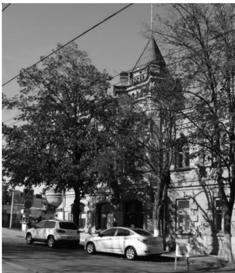
Фото 5. Объект культурного наследия регионального значения «Здание детской художественной школы, в котором в 1918 году выступал с докладом С.М. Киров», 1896 г., Ставропольский край, г. Пятигорск, пр. Кирова, 68. Фрагмент южного фасада.