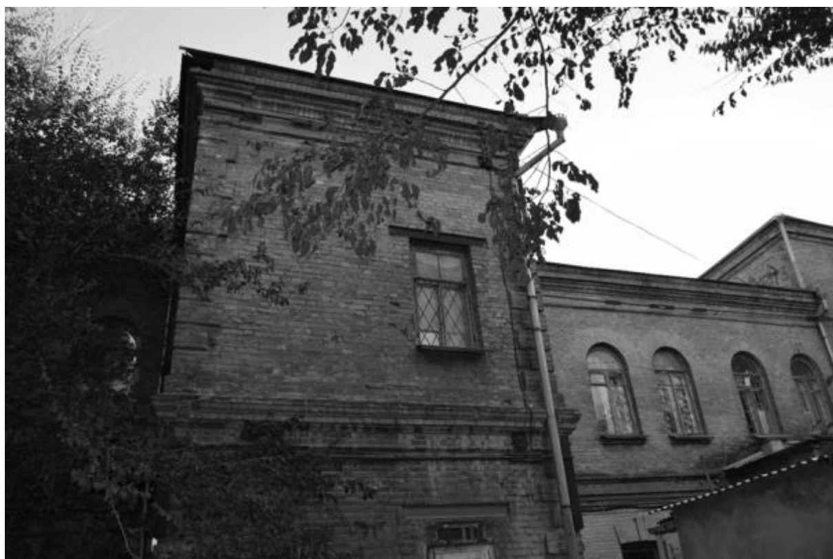
Фото 9. Объект культурного наследия регионального значения «Здание детской художественной школы, в котором в 1918 году выступал с докладом С.М. Киров», 1896 г., Ставропольский край, г. Пятигорск, пр. Кирова, 68. Вид памятника с дворовой территории..