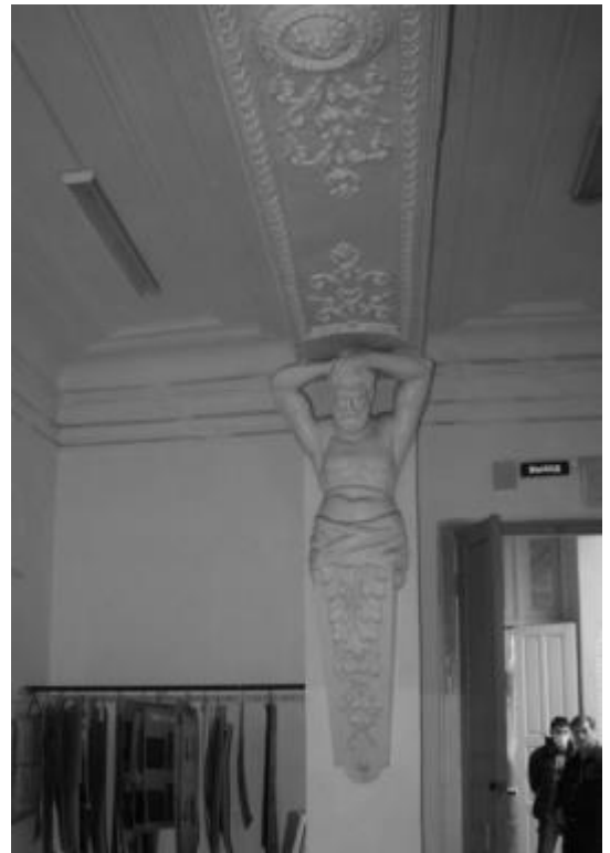
Фото 17-18. Объект культурного наследия регионального значения «Здание детской художественной школы, в котором в 1918 году выступал с докладом С.М. Киров», 1896 г., Ставропольский край, г. Пятигорск, пр. Кирова, 68. Атланты.