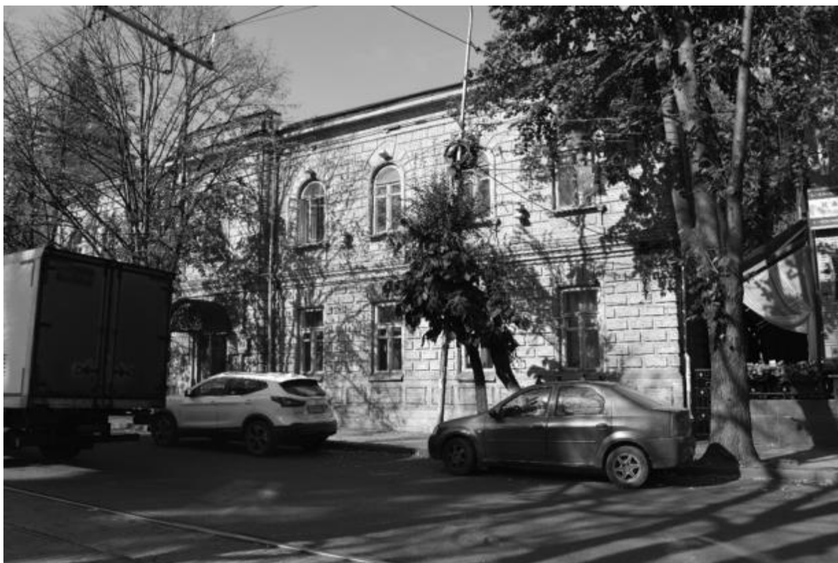
Фото 4. Объект культурного наследия регионального значения «Здание детской художественной школы, в котором в 1918 году выступал с докладом С.М. Киров», 1896 г., Ставропольский край, г. Пятигорск, пр. Кирова, 68. Южный фасад.