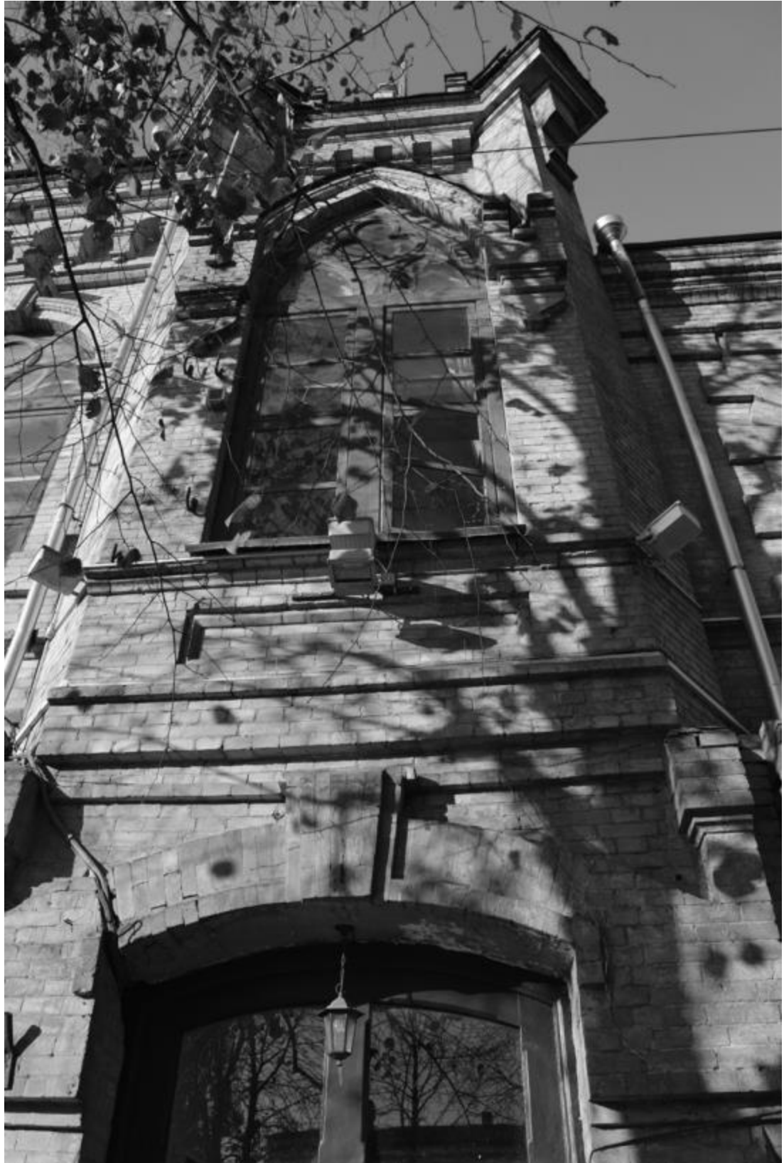
Фото 13. Объект культурного наследия регионального значения «Здание детской художественной школы, в котором в 1918 году выступал с докладом С.М. Киров», 1896 г., Ставропольский край, г. Пятигорск, пр. Кирова, 68. Ризалит главного фасада.