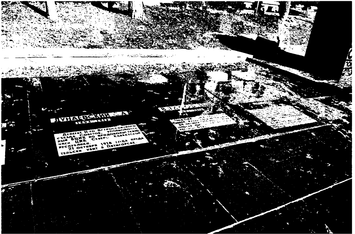
Фото 2-4. Объект культурного наследия регионального значения «Памятник погибшим на Кавказе в годы Гражданской войны», Ставропольский край, г. Пятигорск, пл. Ленина. Мемориальные плиты.