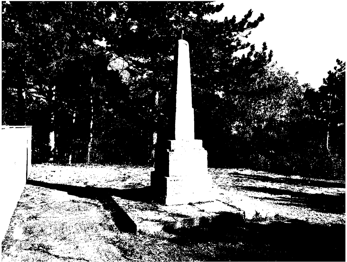
Фото 5. Объект культурного наследия регионального значения «Обелиск на месте казни Г.Г. Анджиевского», 1919 г., Ставропольский край, г. Пятигорск, г. Казачка. Обелиск, вид с запада.