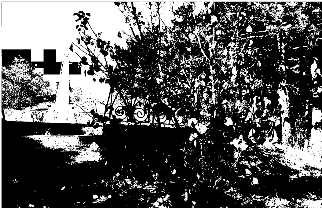
Фото 2. Объект культурного наследия регионального значения «Обелиск на месте казни Г.Г. Анджиевского», 1919 г., Ставропольский край, г. Пятигорск, г. Казачка. Вход на территорию памятника.