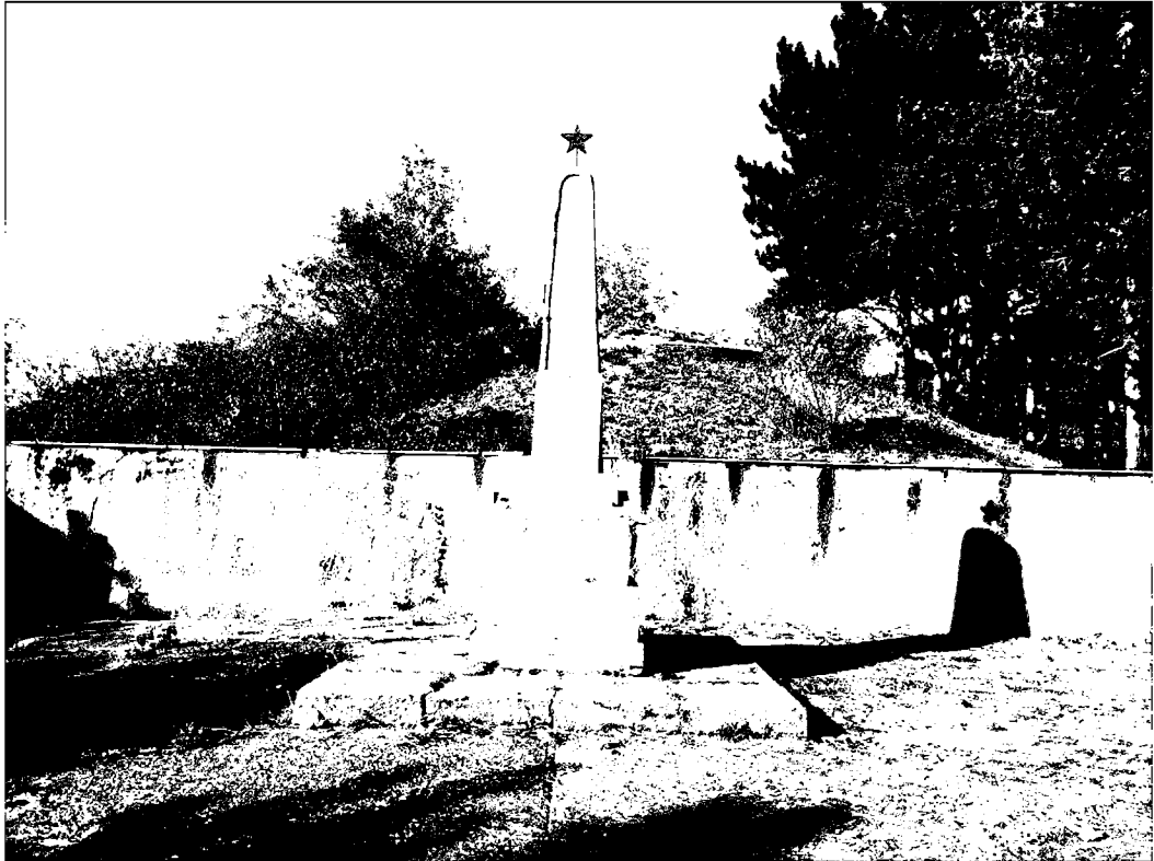
Фото 1. Объект культурного наследия регионального значения «Обелиск на месте казни Г.Г. Анджиевского», 1919 г., Ставропольский край, г. Пятигорск, г. Казачка. Общий вид.