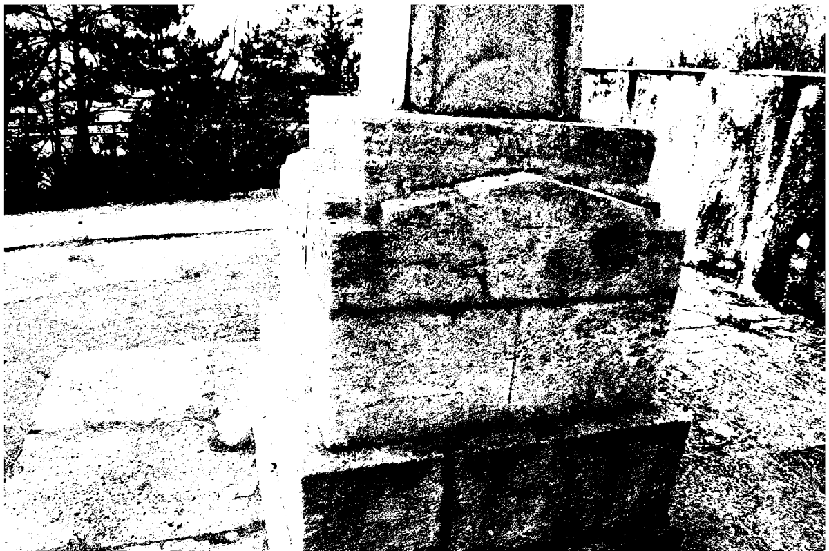
Фото 6. Объект культурного наследия регионального значения «Обелиск на месте казни Г.Г. Анджиевского», 1919 г., Ставропольский край, г. Пятигорск, г. Казачка. Основание обелиска.