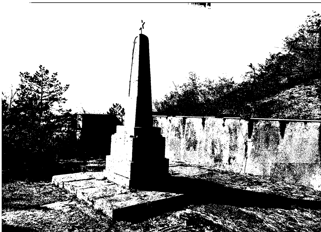
Фото 4. Объект культурного наследия регионального значения «Обелиск на месте казни Г.Г. Анджиевского», 1919 г., Ставропольский край, г. Пятигорск, г. Казачка. Обелиск, вид с востока.