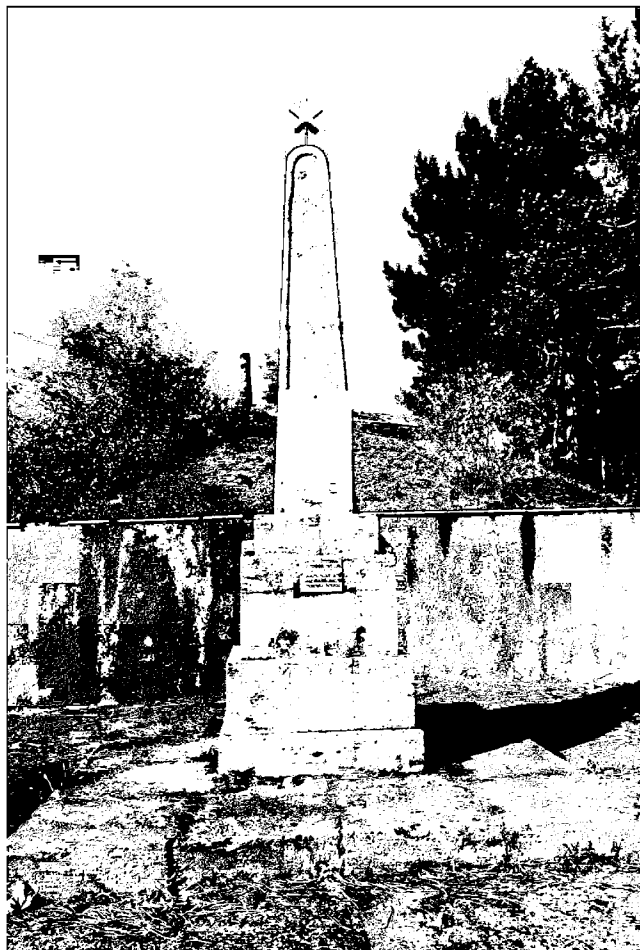
Фото 3. Объект культурного наследия регионального значения «Обелиск на месте казни Г.Г. Анджиевского», 1919 г., Ставропольский край, г. Пятигорск, г. Казачка. Обелиск, общий вид.