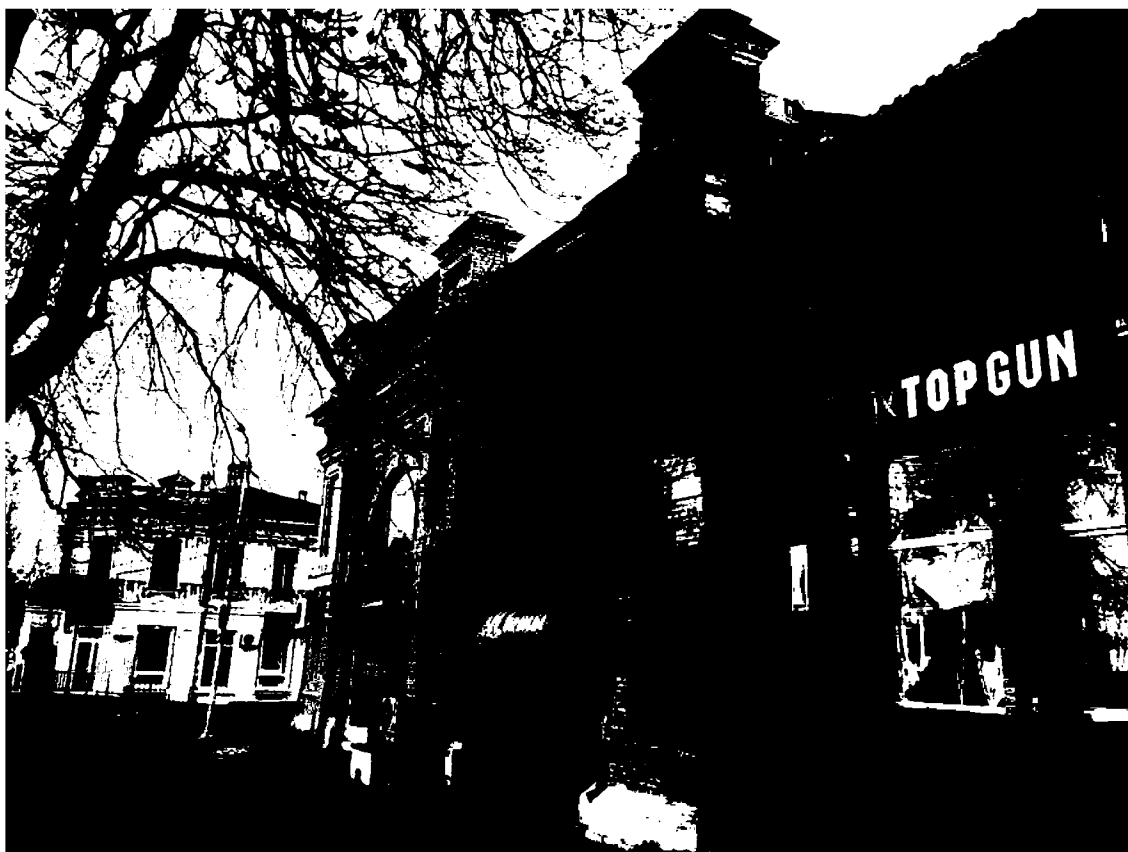
Фото 4. Объект культурного наследия регионального значения «Магазин», конец XIX в., Ставропольский край, г. Пятигорск, ул. Крайнего, 47. Южный фасад (вид с ул. Октябрьской).