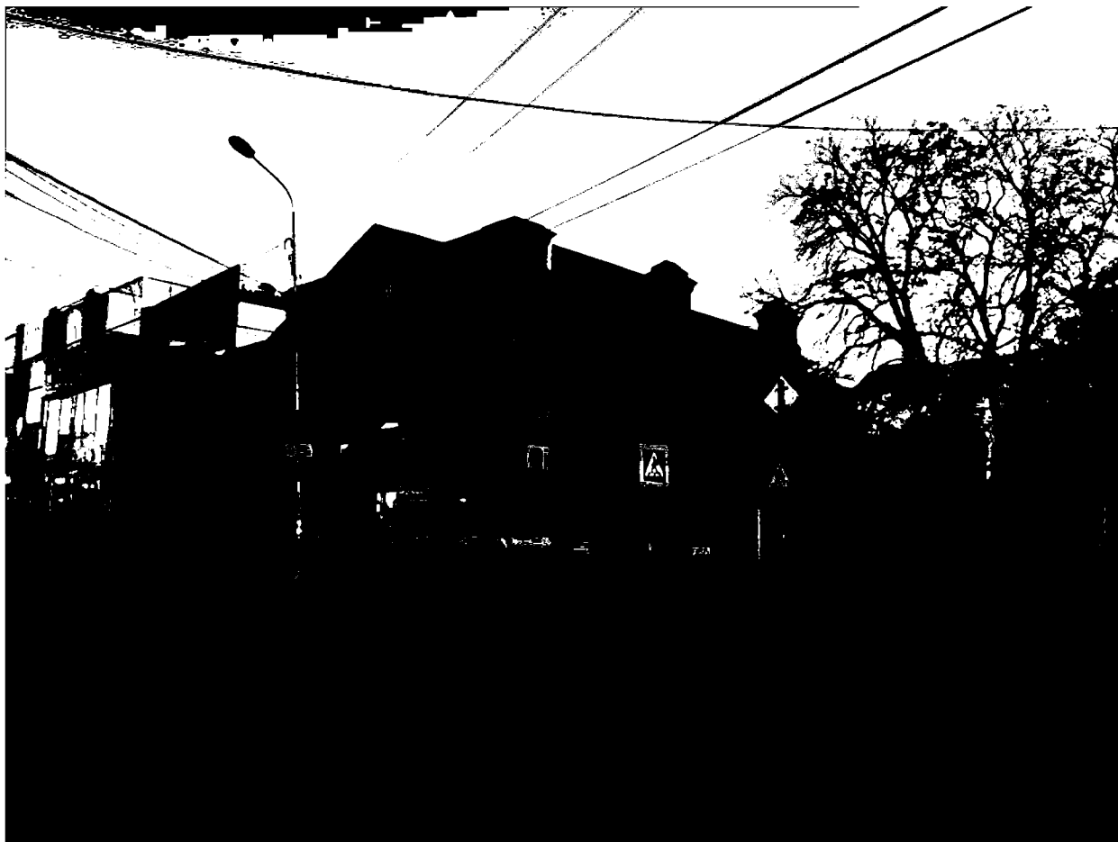
Фото 1. Объект культурного наследия регионального значения «Магазин», конец XIX в., Ставропольский край, г. Пятигорск, ул. Крайнего, 47. Общий вид памятника с ул. Крайнего.