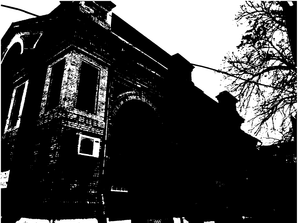
Фото 3. Объект культурного наследия регионального значения «Магазин», конец XIX в., Ставропольский край, г. Пятигорск, ул. Крайнего, 47. Южный фасад.