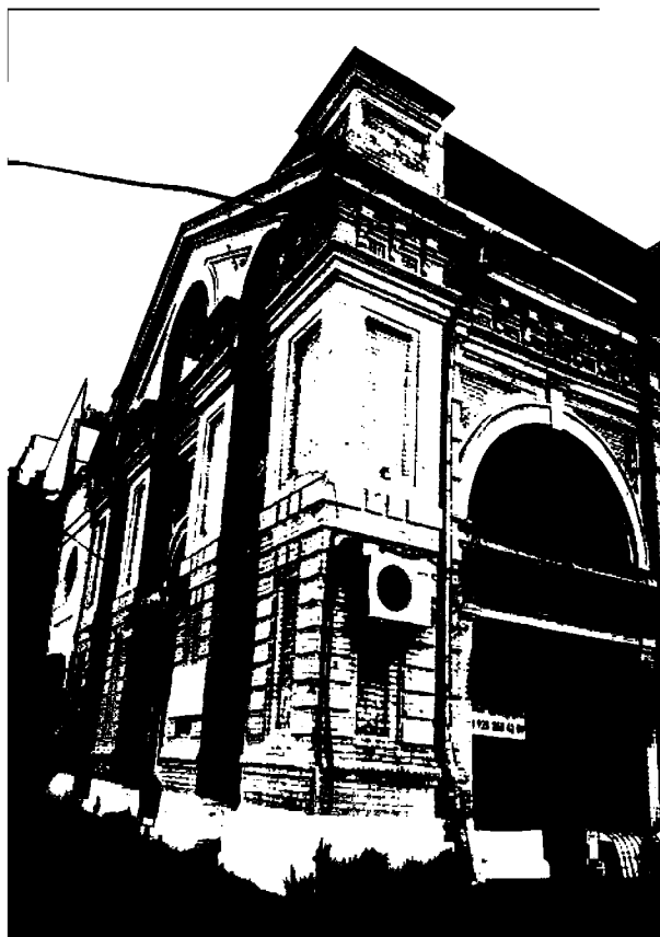
Фото 5-6. Объект культурного наследия регионального значения «Магазин», конец XIX в., Ставропольский край, г. Пятигорск, ул. Крайнего, 47. Фрагменты отделки фасадов.