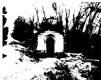
часовня Э.Б. Ходжаева