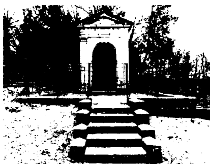
часовня В.А. Башкирова

включая ограды, подпорные стены, лестницы, кованые металлические ворота.