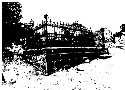
кованные ажурная ограда на каменном основании