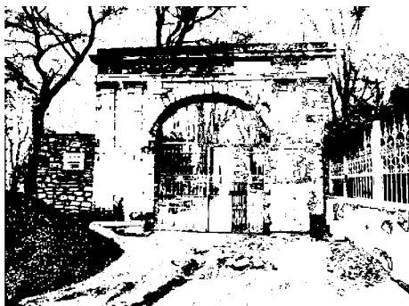
входные ворота кладбища