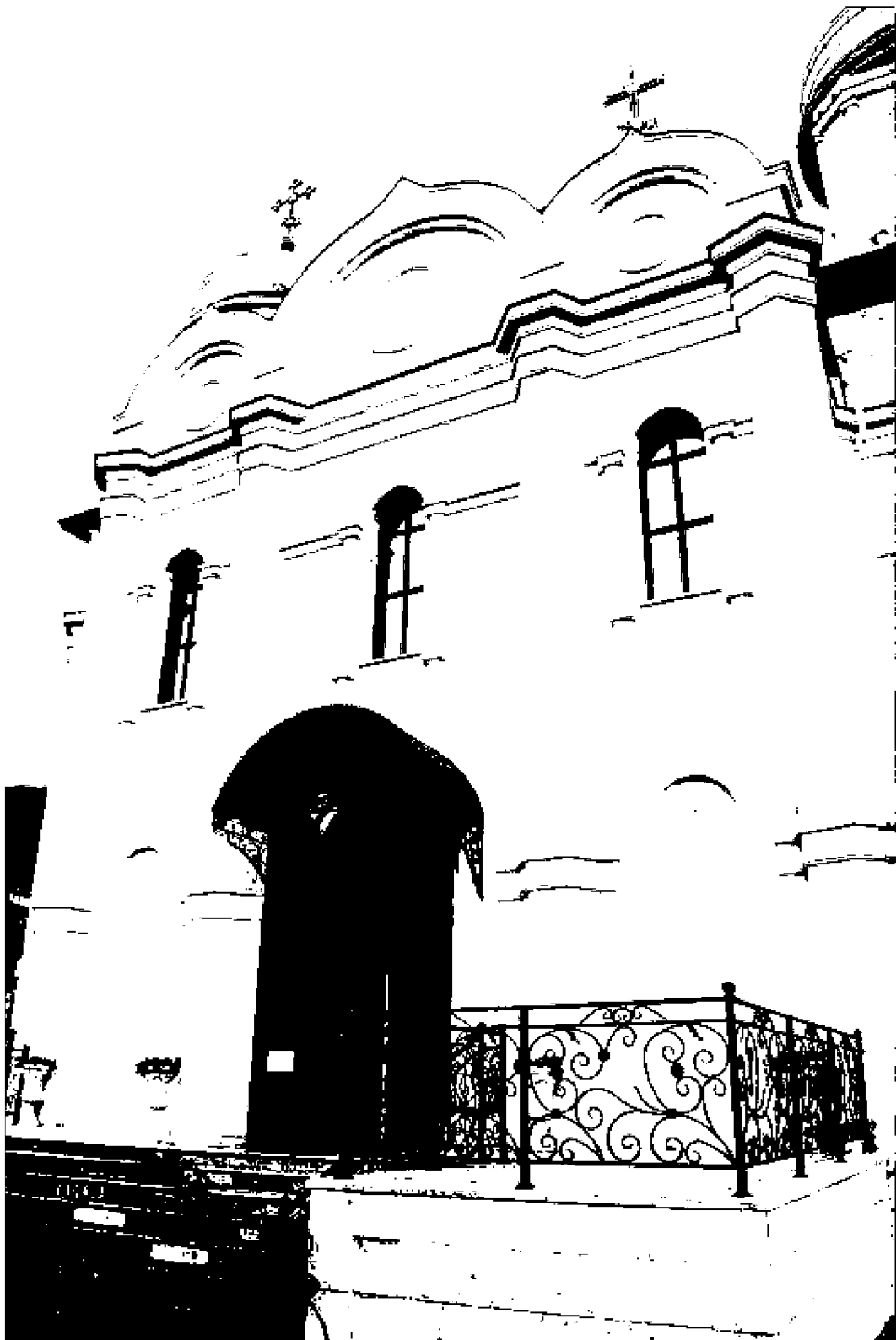
Фото 6. Объект культурного наследия регионального значения «Спасский собор», 1869 год, расположен по адресу: Ставропольский край, г. Пятигорск, ул. Соборная, д. 1. Фрагмент фасада.