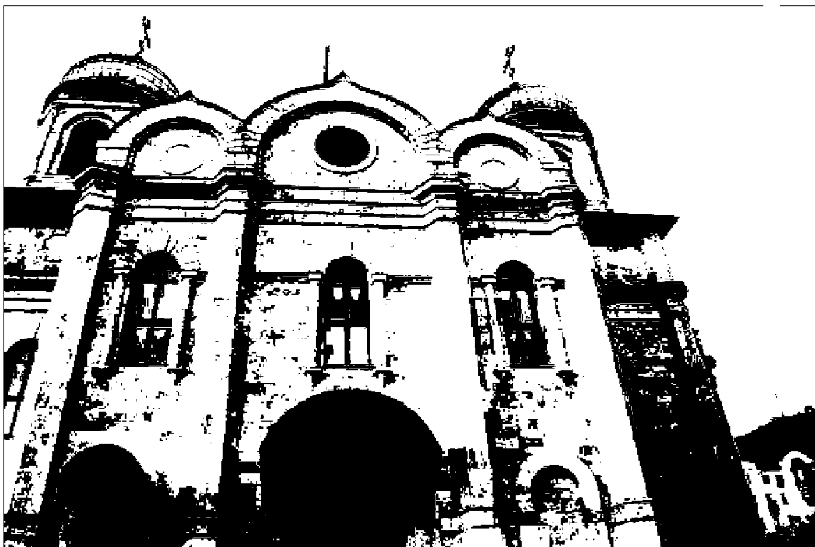
Фото 5. Объект культурного наследия регионального значения «Спасский собор», 1869 год, расположен по адресу: Ставропольский край, г. Пятигорск, ул. Соборная, д. 1. Фрагмент фасада.