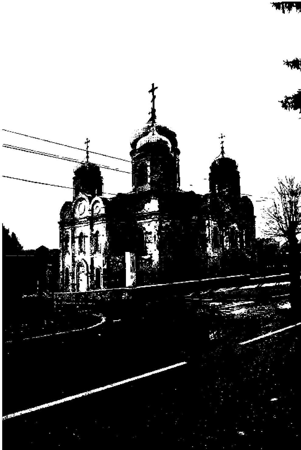
Фото 1. Объект культурного наследия регионального значения «Спасский собор», 1869 год, расположен по адресу: Ставропольский край, г. Пятигорск, ул. Соборная, д. 1.