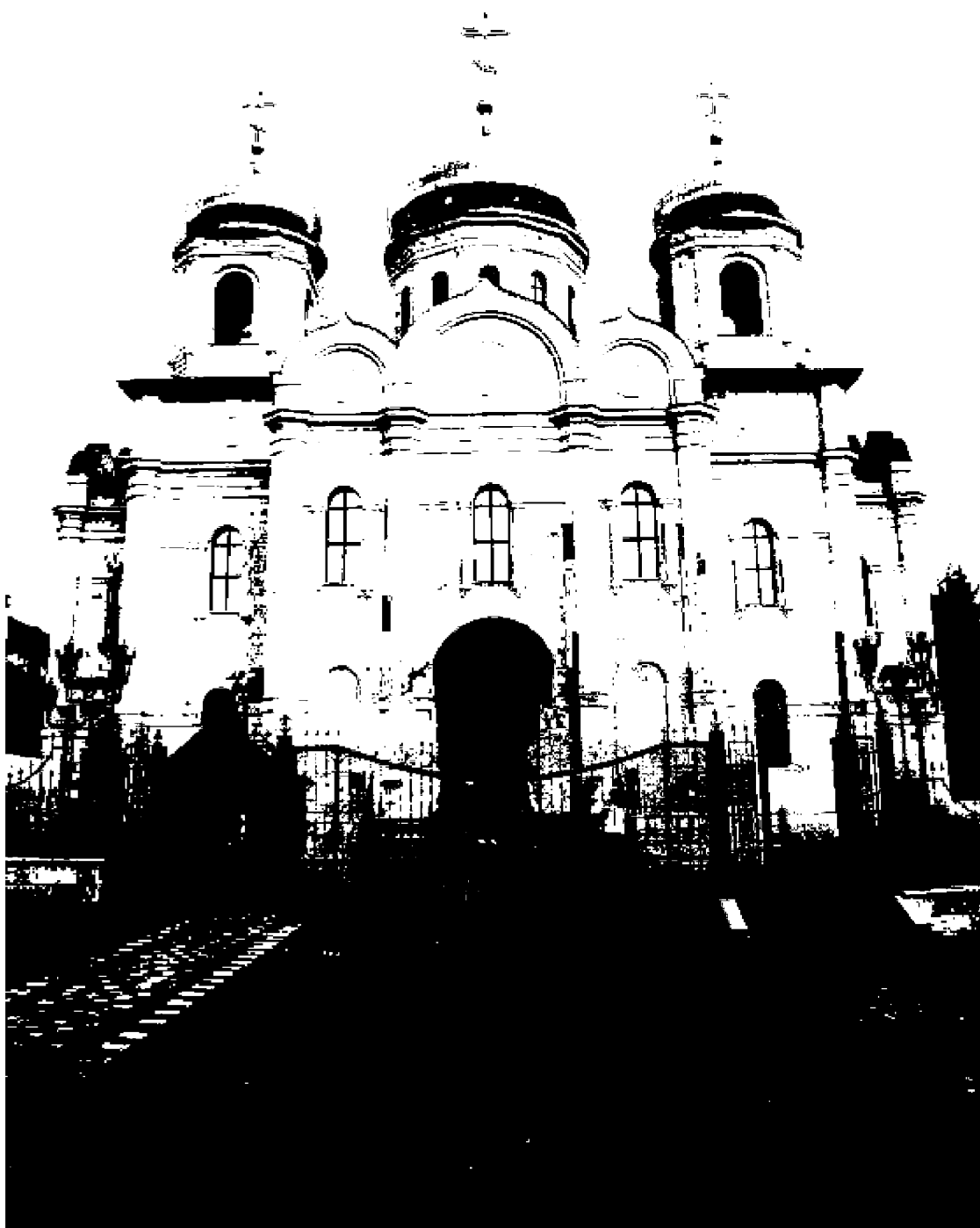
Фото 3. Объект культурного наследия регионального значения «Спасский собор», 1869 год, расположен по адресу: Ставропольский край, г. Пятигорск, ул. Соборная, д. 1.