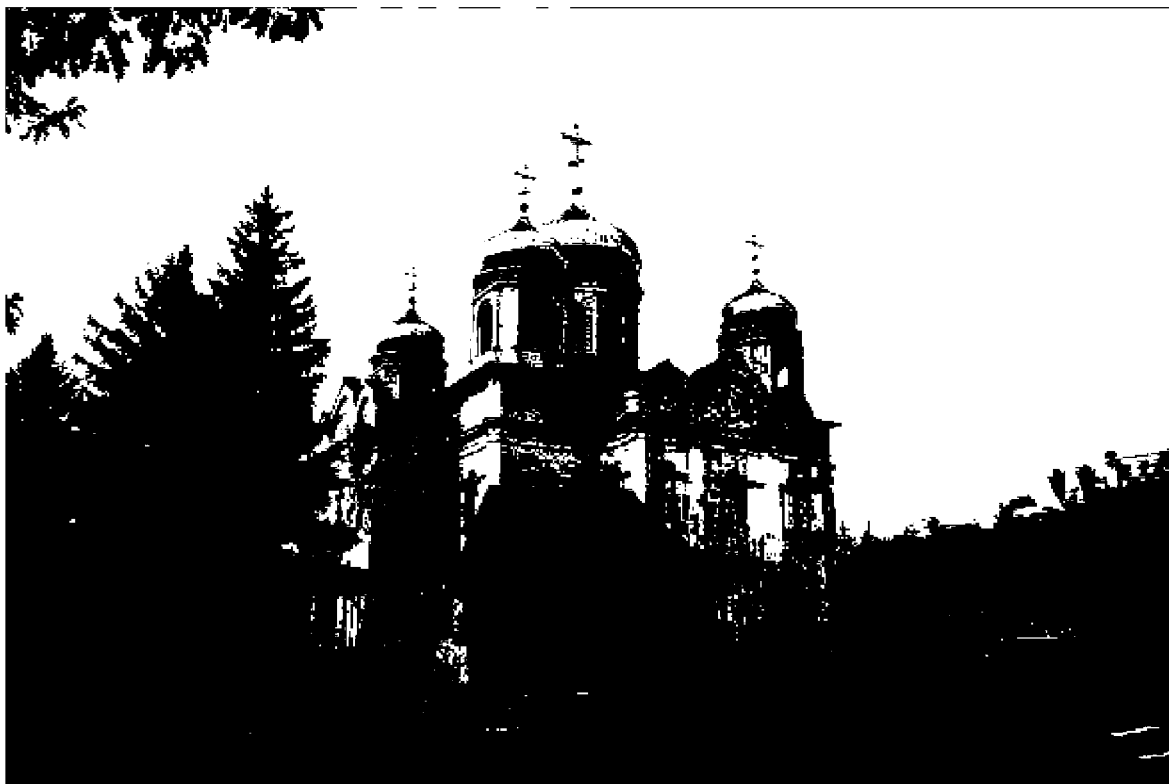
Фото 4. Объект культурного наследия регионального значения «Спасский собор», 1869 год, расположен по адресу: Ставропольский край, г. Пятигорск, ул. Соборная, д. 1. Общий вид памятника с просп. Кирова.