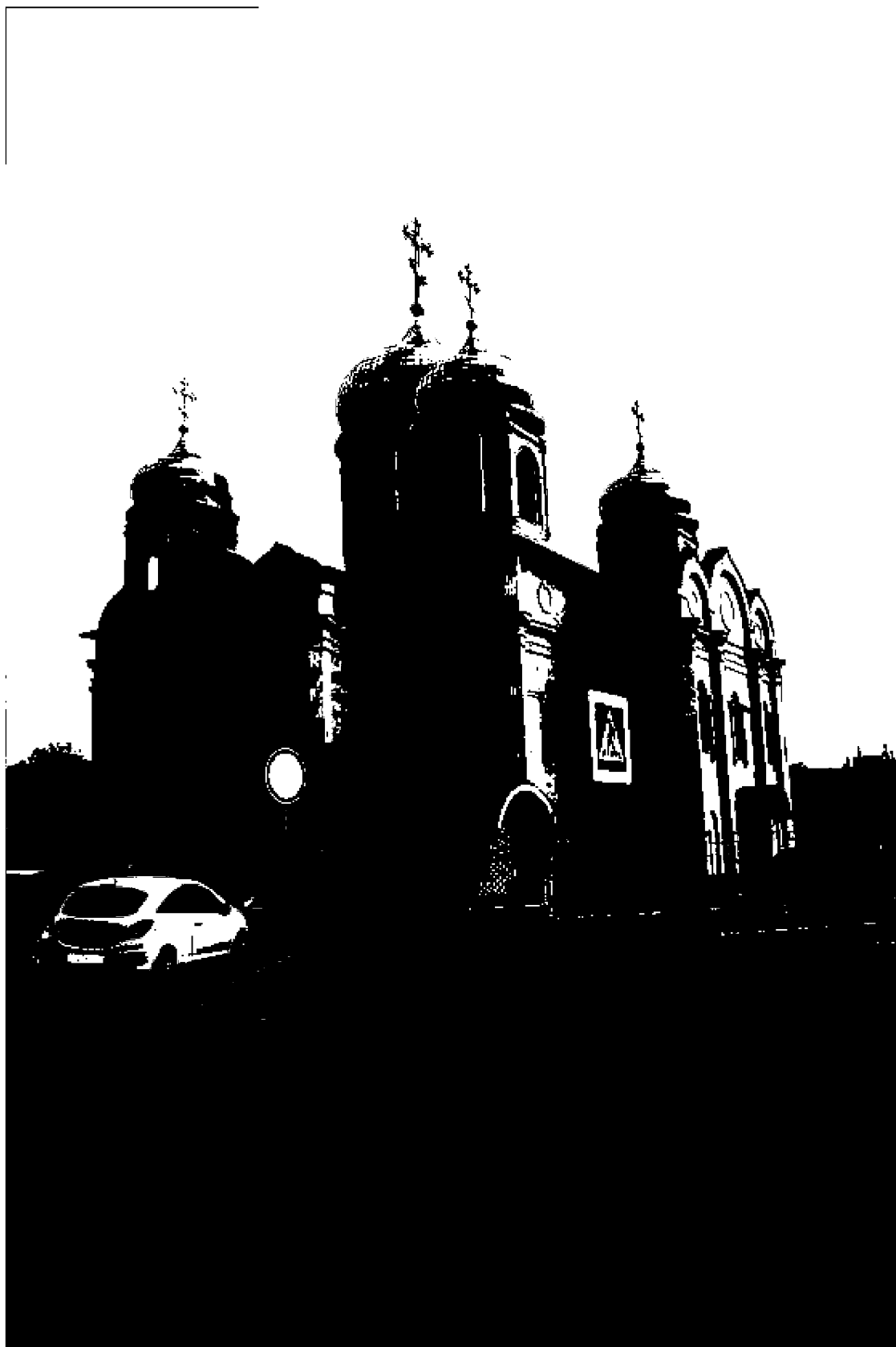
Фото 2. Объект культурного наследия регионального значения «Спаский собор», 1869 год, расположен по адресу: Ставропольский край, г. Пятигорск, ул. Соборная, д. 1. Общий вид памятника с ул. Красноармейской.

Общий вид памятника с ул. Красноармейской.