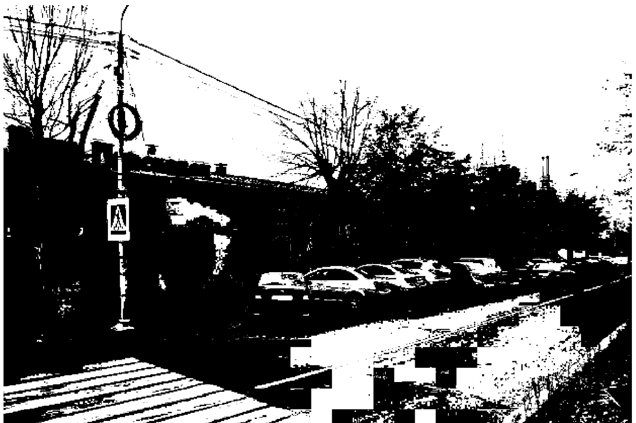
Фото 4. Объект культурного наследия регионального значения «Здание, часть комплекса «Ресторации», 1825 год, расположен по адресу: Ставропольский край, г. Пятигорск, ул. Красноармейская, д. 6. Фасад по ул. Красноармейской.