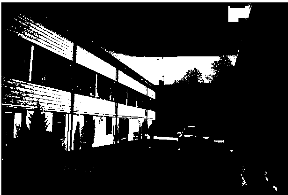
Фото 10-11. Объект культурного наследия регионального значения «Здание, часть комплекса «Ресторации», 1825 год, расположенного по адресу: Ставропольский край, г. Пятигорск, ул. Красноармейская, д. 6. Общий вид памятника с дворовой территории (литеры «Б», «В1», «В»).