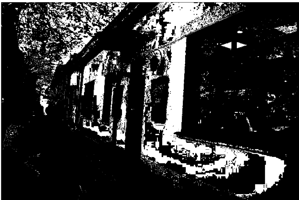
Фото 6-7. Объект культурного наследия регионального значения «Здание, часть комплекса «Ресторации», 1825 год, расположен по адресу: Ставропольский край, г. Пятигорск, ул. Красноармейская, д. 6. Общий вид фасада по ул. Красноармейской.