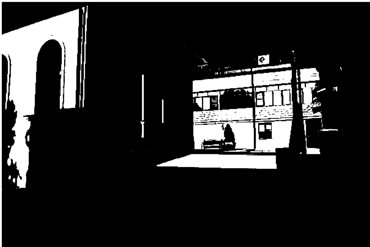
Фото 12. Объект культурного наследия регионального значения «Здание, часть комплекса «Ресторации», 1825 год, расположен по адресу: Ставропольский край, г. Пятигорск, ул. Красноармейская, д. 6. Общий вид памятника с дворовой территории.