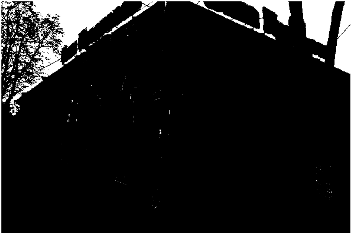
Фото 2. Объект культурного наследия регионального значения «Здание, часть комплекса «Ресторации», 1825 год, расположен по адресу: Ставропольский край, г. Пятигорск, ул. Красноармейская, д. 6. Общий вид памятника с перекрестка ул. Карла Маркса и ул. Красноармейской.