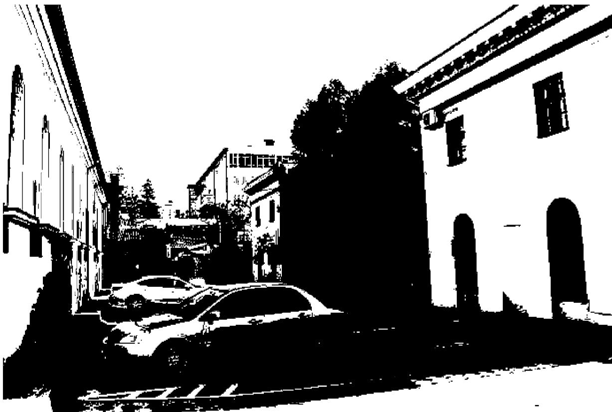
Фото 13-15. Объект культурного наследия регионального значения «Здание, часть комплекса «Ресторации», 1825 год, расположен по адресу: Ставропольский край, г. Пятигорск, ул. Красноармейская, д. 6. Общий вид памятника (литер «В») с дворовой территории.