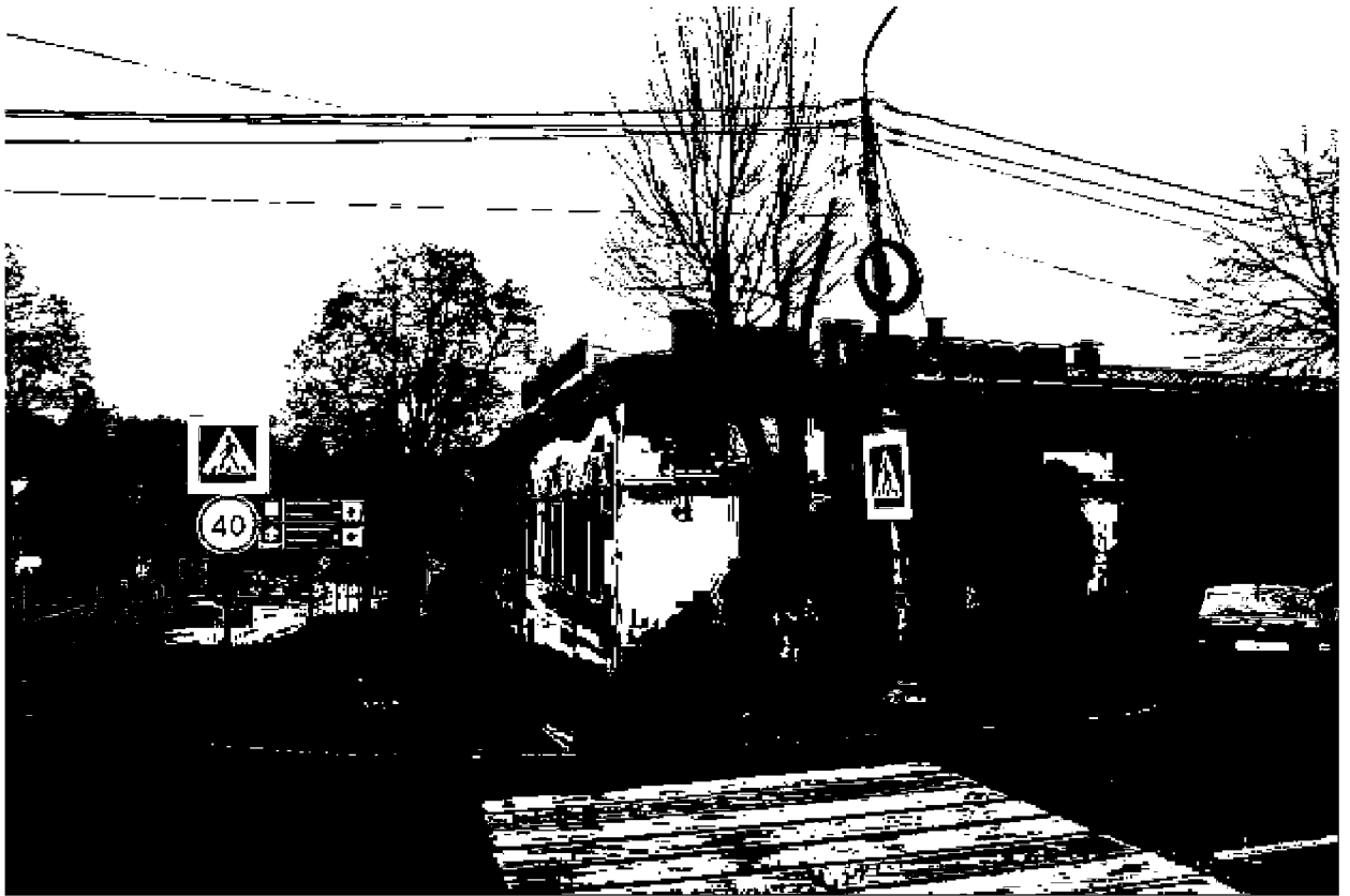
Фото 1. Объект культурного наследия регионального значения «Здание, часть комплекса «Ресторации», 1825 год, расположен по адресу: Ставропольский край, г. Пятигорск, ул. Красноармейская, д. 6. Общий вид памятника с перекрестка ул. Красноармейской и ул. Карла Маркса.