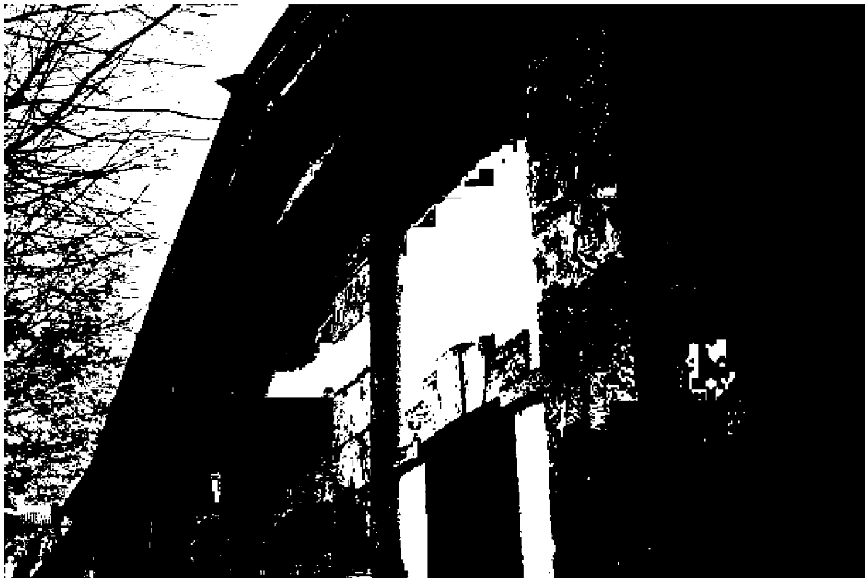
Фото 8. Объект культурного наследия регионального значения «Здание, часть комплекса «Ресторации», 1825 год, расположен по адресу: Ставропольский край, г. Пятигорск, ул. Красноармейская, д. 6. Фрагмент оформления фасада по ул. Красноармейской.