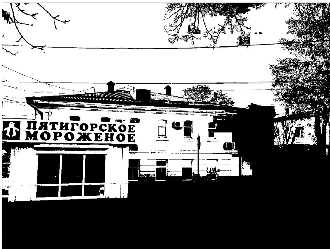
Фото 2. Объект культурного наследия регионального значения «Магазин», конец XIX века, расположен по адресу: Ставропольский край, г. Пятигорск, ул. Университетская, д. 1. Общий вид памятника с ул. Университетская.