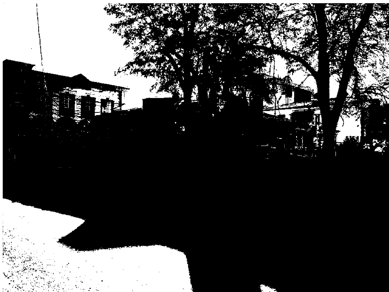
Фото 1. Объект культурного наследия регионального значения «Магазин», конец XIX века, расположен по адресу: Ставропольский край, г. Пятигорск, ул. Университетская, д. 1. Общий вид памятника с ул. Университетская.