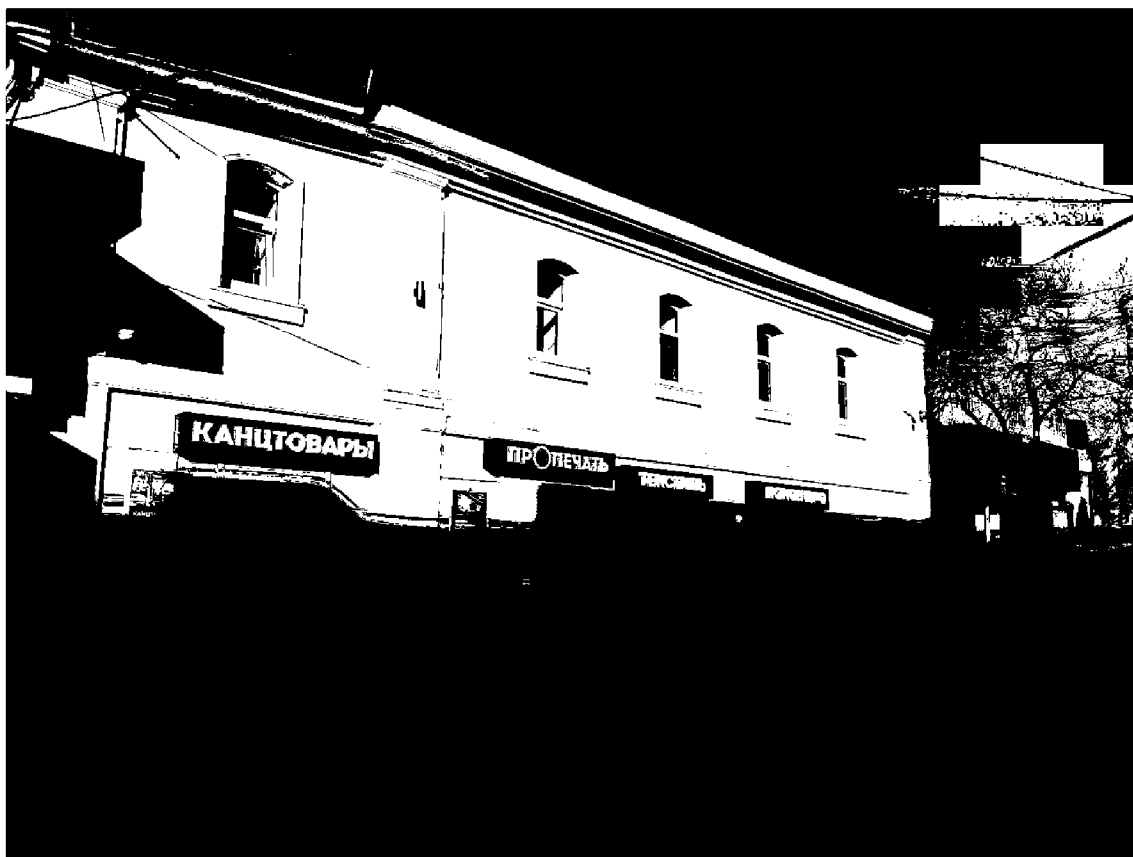
Фото 4. Объект культурного наследия регионального значения «Магазин», конец XIX века, расположен по адресу: Ставропольский край, г. Пятигорск, ул. Университетская, д. 1. Общий вид памятника с ул. Крайнего.