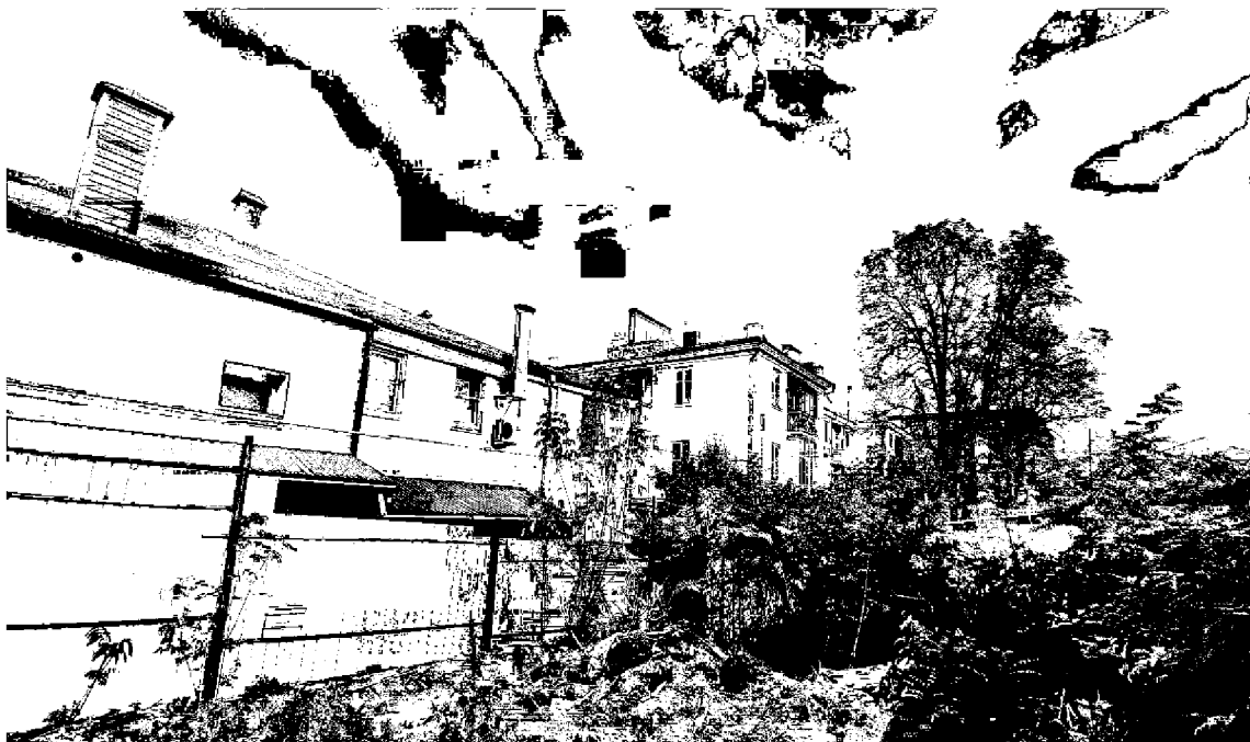
Фото 5. Объект культурного наследия регионального значения «Магазин», конец XIX века, расположен по адресу: Ставропольский край, г. Пятигорск, ул. Университетская, д. 1. Дворовый фасад.