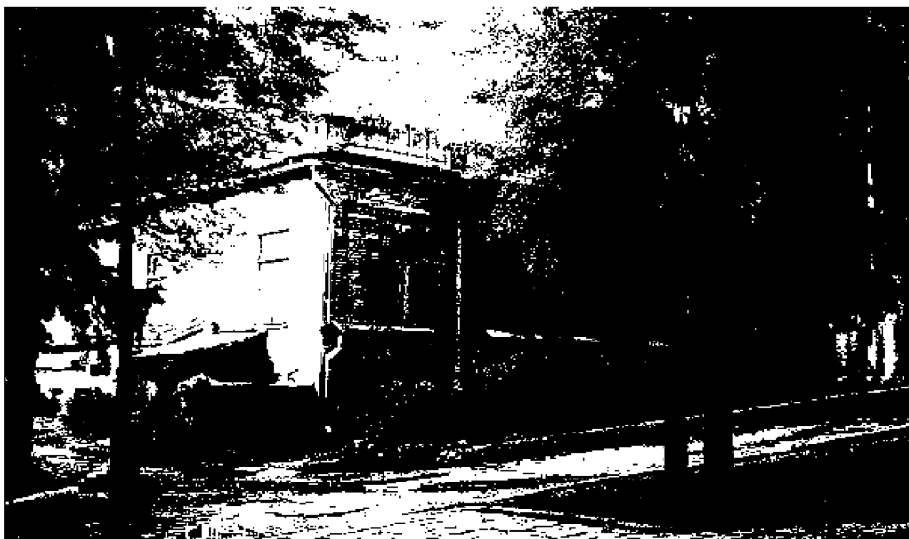
Фото 9-12. Объект культурного наследия регионального значения «Дом княжны Мери, описанный Лермонтовым в романе «Герой нашего времени», расположен по адресу: Ставропольский край, г. Пятигорск, просп. Кирова, д. 12а. Историческое композиционное решение и архитектурно-художественное оформление фасадов памятника.