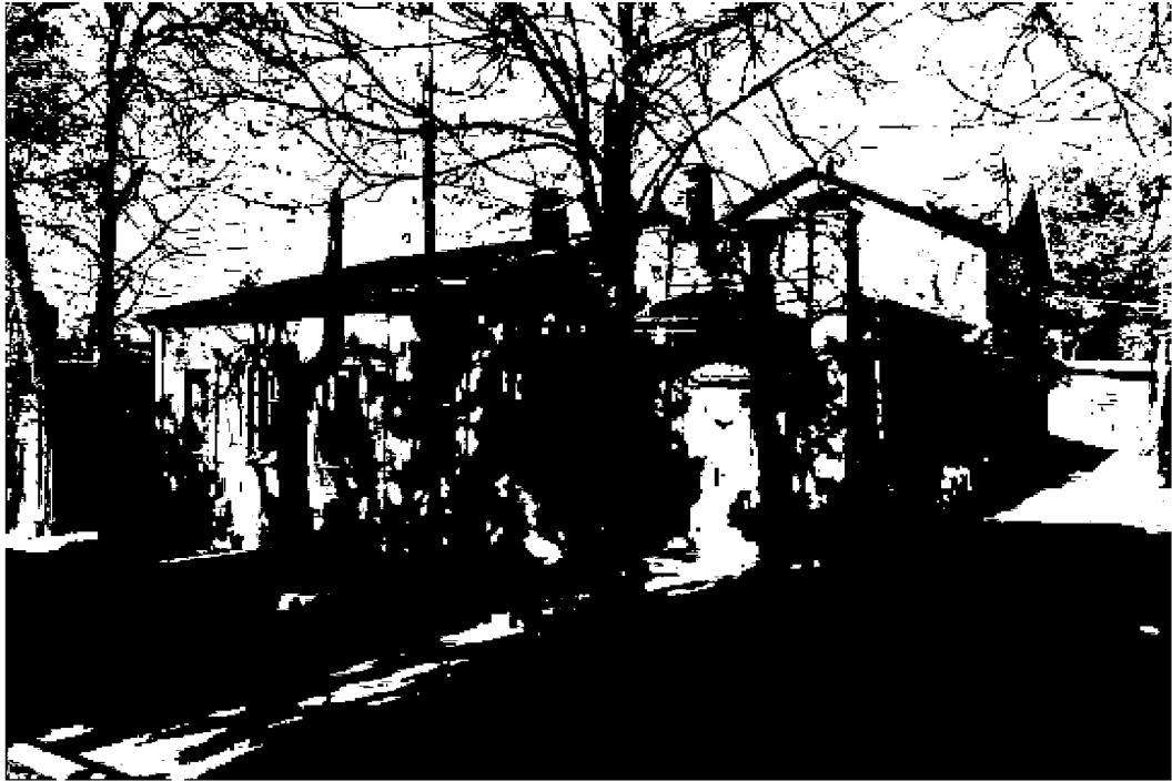
Фото 1. Объект культурного наследия регионального значения «Дом княжны Мери, описанный Лермонтовым в романе «Герой нашего времени», расположен по адресу: Ставропольский край, г. Пятигорск, просп. Кирова, д. 12а. Общий вид памятника с просп. Кирова.