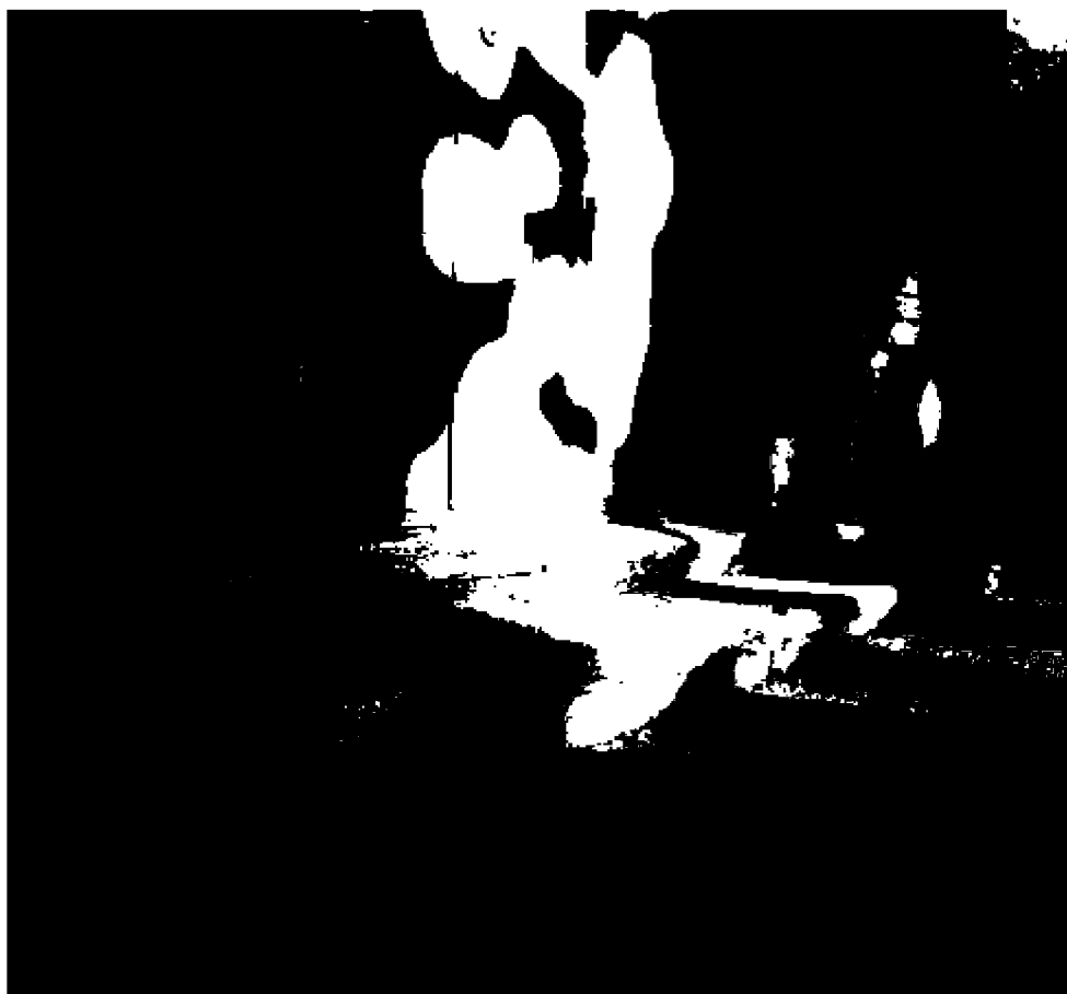
Фото 8. Объект культурного наследия регионального значения «Дом княжны Мери, описанный Лермонтовым в романе «Герой нашего времени», расположен по адресу: Ставропольский край, г. Пятигорск, просп. Кирова, д. 12а. Ступени главного входа.