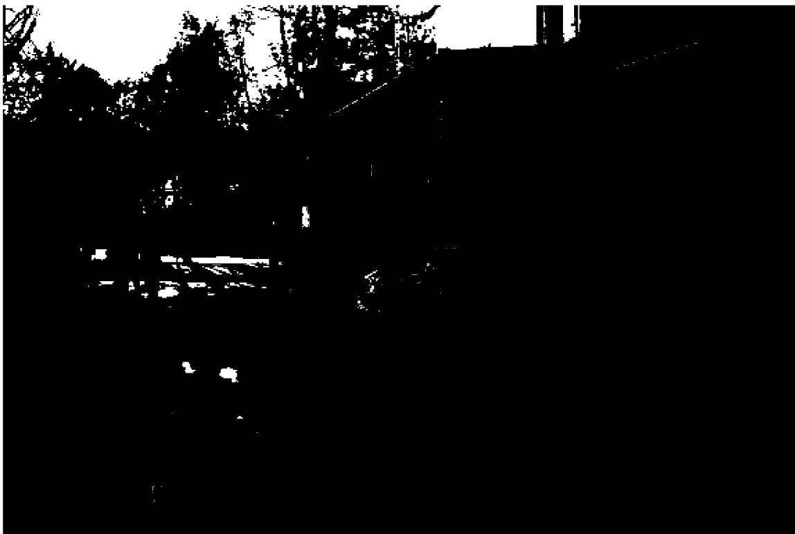
Фото 7. Объект культурного наследия регионального значения «Дом княжны Мери, описанный Лермонтовым в романе «Герой нашего времени», расположен по адресу: Ставропольский край, г. Пятигорск, просп. Кирова, д. 12а. Общий вид памятника с северо-востока.