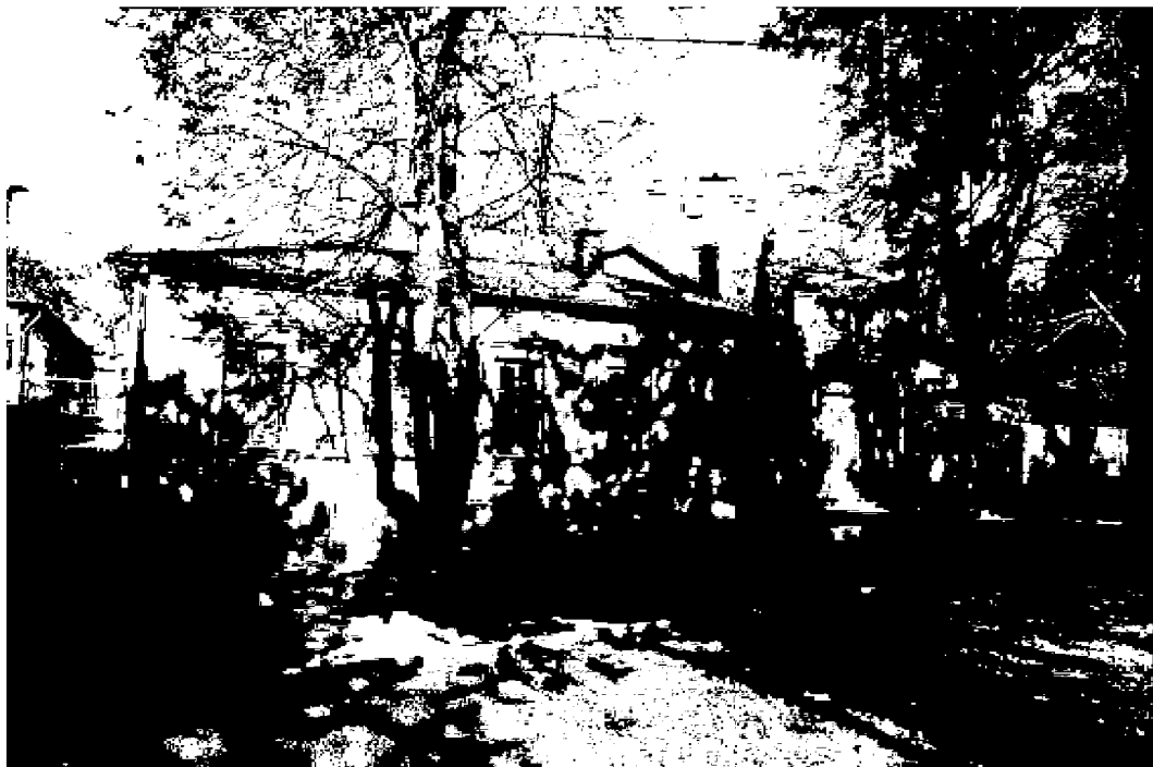
Фото 2. Объект культурного наследия регионального значения «Дом княжны Мери, описанный Лермонтовым в романе «Герой нашего времени», расположен по адресу: Ставропольский край, г. Пятигорск, просп. Кирова, д. 12а.