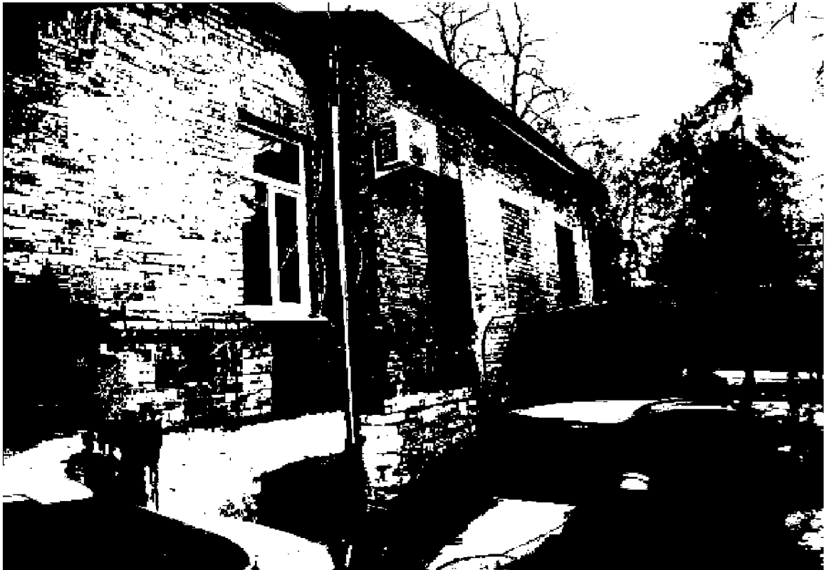
Фото 5. Объект культурного наследия регионального значения «Дом княжны Мери, описанный Лермонтовым в романе «Герой нашего времени», расположен по адресу: Ставропольский край, г. Пятигорск, просп. Кирова, д. 12а. Юго-западный фасад.