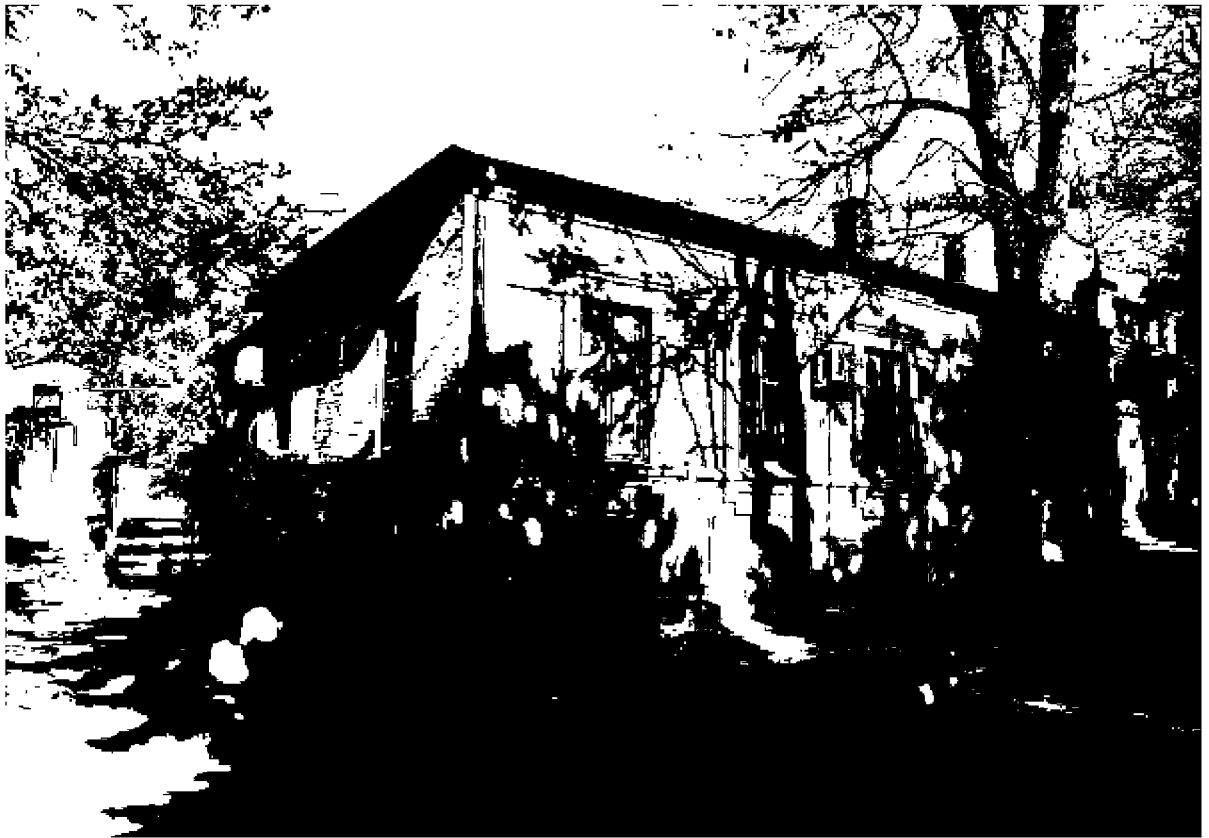
Фото 3. Объект культурного наследия регионального значения «Дом княжны Мери, описанный Лермонтовым в романе «Герой нашего времени», расположен по адресу: Ставропольский край, г. Пятигорск, просп. Кирова, д. 12а. Общий вид памятника с просп. Кирова.