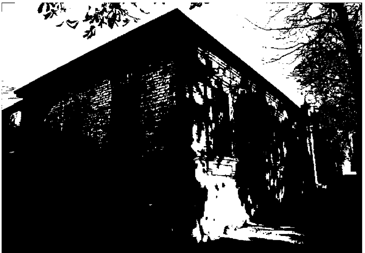
Фото 4. Объект культурного наследия регионального значения «Дом княжны Мери, описанный Лермонтовым в романе «Герой нашего времени», расположен по адресу: Ставропольский край, г. Пятигорск, просп. Кирова, д. 12а. Общий вид памятника с просп. Кирова.