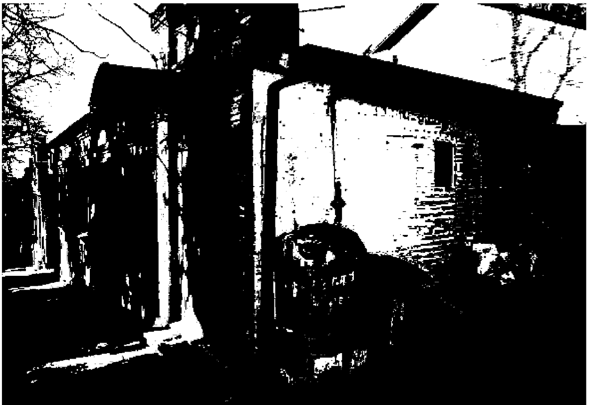
Фото 6. Объект культурного наследия регионального значения «Дом княжны Мери, описанный Лермонтовым в романе «Герой нашего времени», расположен по адресу: Ставропольский край, г. Пятигорск, просп. Кирова, д. 12а. Северо-восточный фасад.