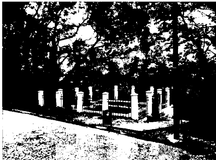
Фото 2. Объект культурного наследия регионального значения «Мои́ла жертв фашистского террора», 1943 год, расположен по адресу: Ставропольский край, г. Пятигорск, в 1 км от Провала. Общий вид памятника.