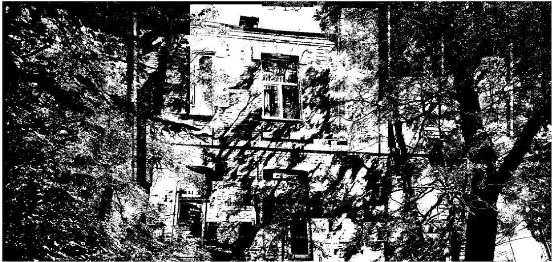
5. Выступающий полуромбовидный эркер на углу здания, обращенного в сторону пересечения проспекта Первомайского и переулка Яновского: