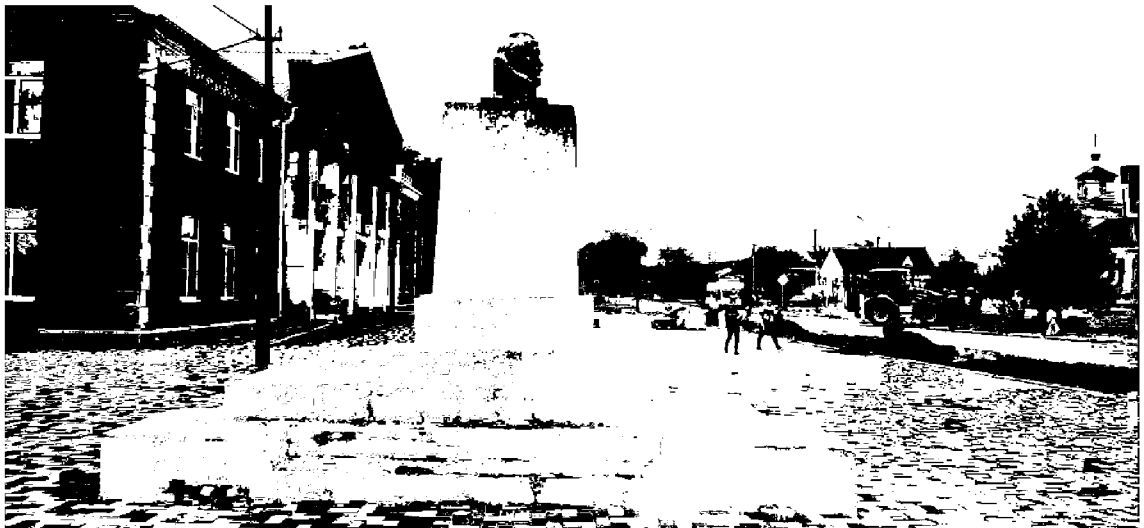
Вид на памятник с востока, со стороны ул. Ленина

3. Историческое композиционное решение и архитектурно-художественное оформление памятника включая постамент памятника и ростовую скульптуру В.И.Ленина.