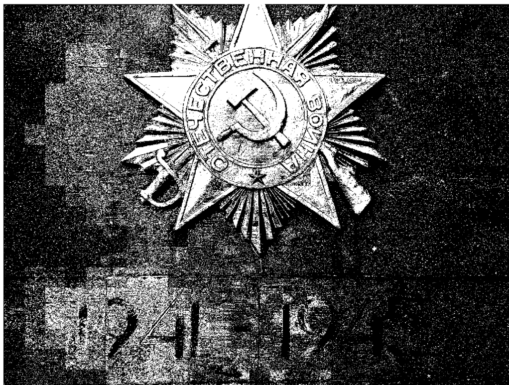
Фото 5 - Орден Отечественной войны