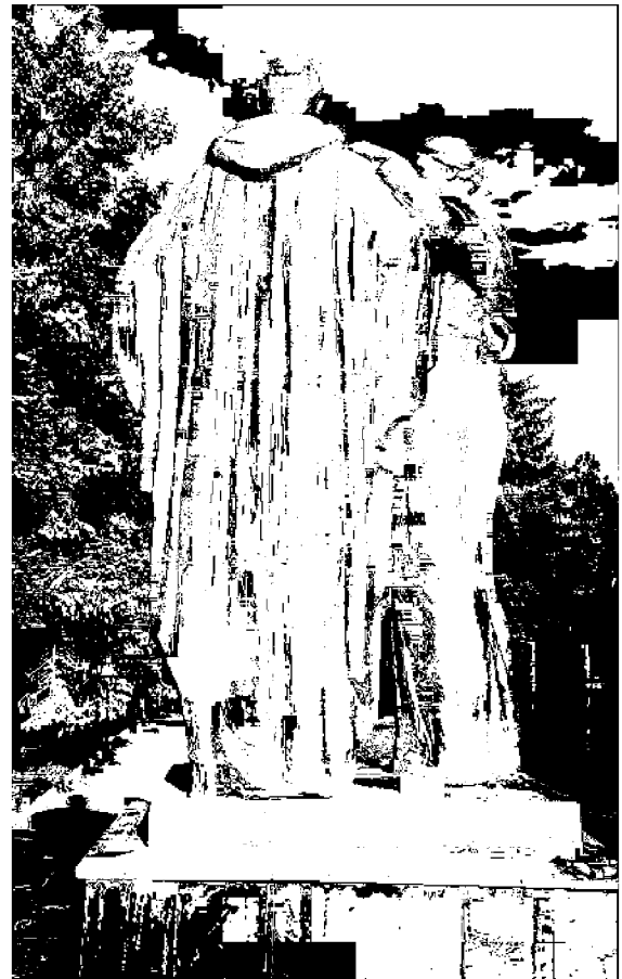
Фото 7, 8 - Скульптура воина и матери