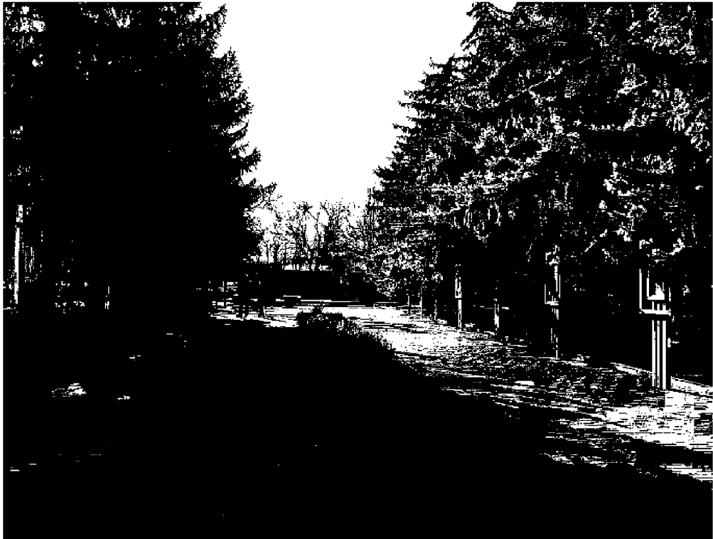
Фото 1 - Общий вид на монумент с Аллеи Героев

объекта культурного наследия регионального значения «Братская могила мирных жителей, расстрелянных фашистами в годы Великой Отечественной войны», расположенного по адресу: Ставропольский край, Андроповский район, с. Курсавка, северная сторона (фактический адрес: Ставропольский край, Андроповский район, с. Курсавка, ул. Красная, парк)