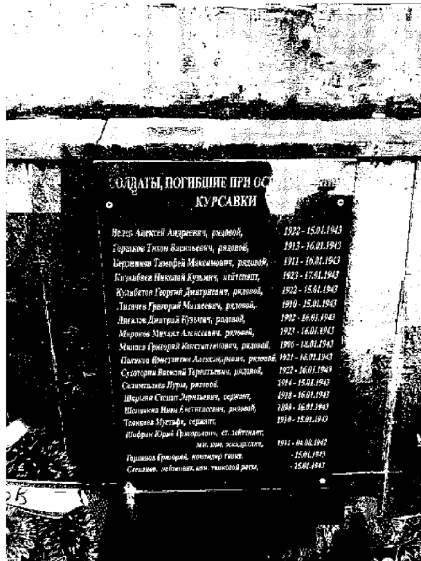
Фото 9 - Памятная табличка