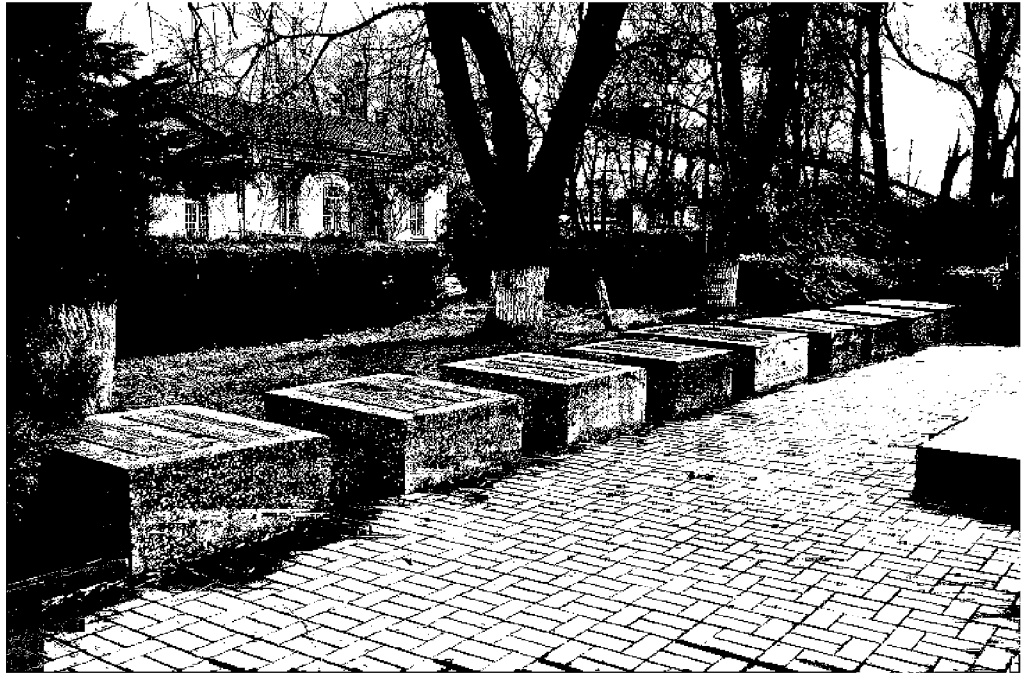
Фото 10 - Общий вид композиции памятных тумб: девять тумб. Брусчатка площадки монумента.