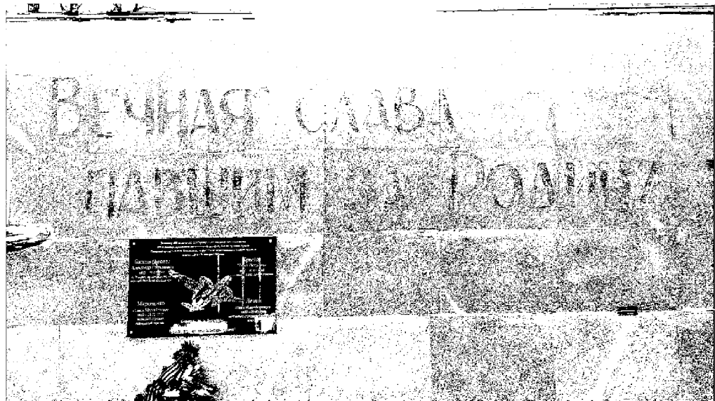
Фото 6 - Мемориальная стена. Памятная надпись