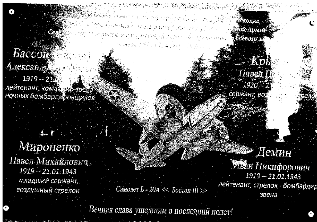
Фото 4 - Памятная плита с именами героев на мемориальной стене