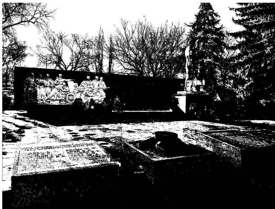
Фото 2 - Общий вид на монумент в три четверти