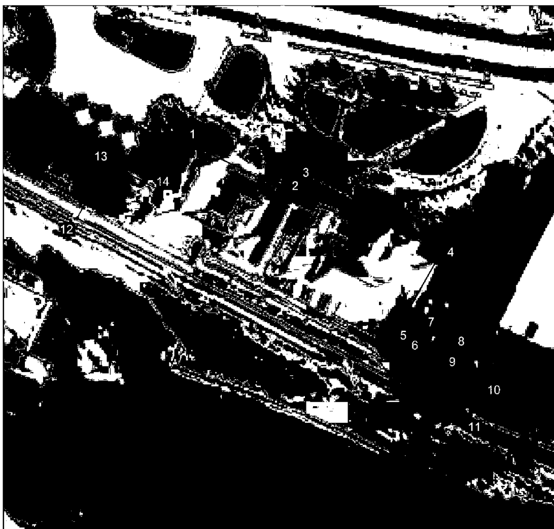
Схема расположения характерных точек границы территории памятника