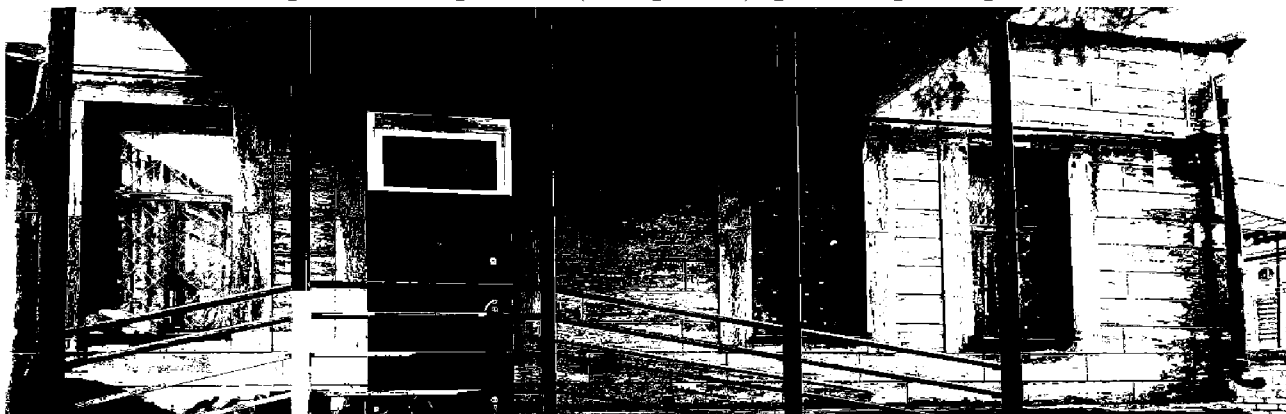
- оконный проем дворового (восточного) фасада, размер: 1,0x2,1 м: