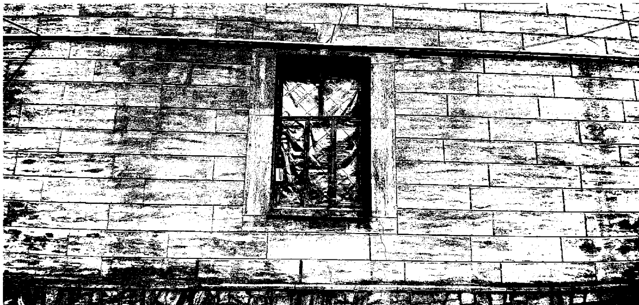
- оконные проемы дворового (северного) фасада, размер 1.2x2.1 м: