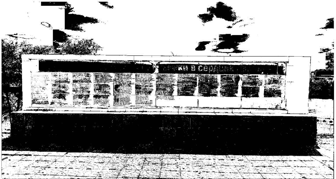
9. Местоположение и габариты стилобата (размер в плане 4,90х3,60 м, высота 0,30 м от уровня площадки):