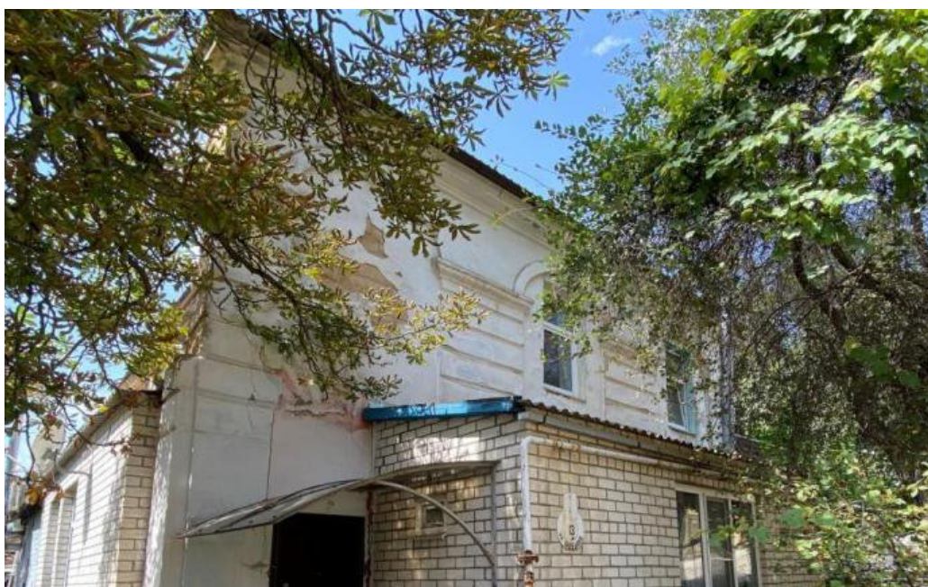
Декоративный элемент: рустованные пилястры