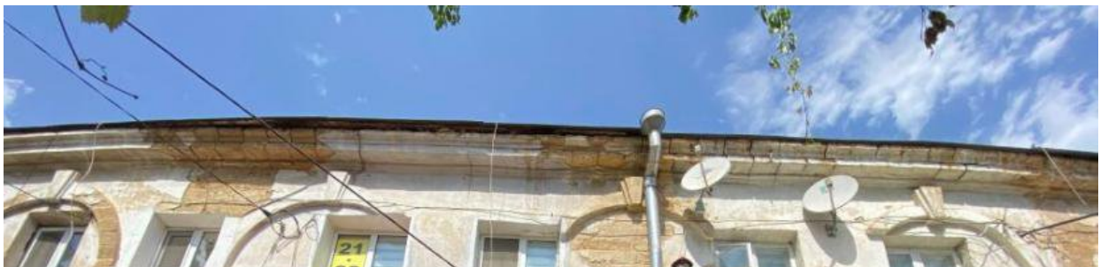
Декоративный элемент: венчающий карниз