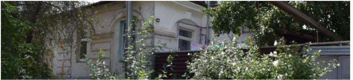
Декоративные элементы: слепые арки с замковым камнем