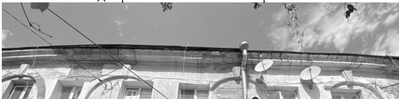
Декоративный элемент: венчающий карниз