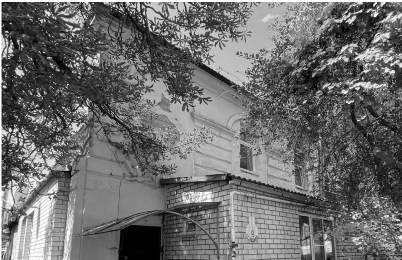
Декоративный элемент: рустованные пилястры.