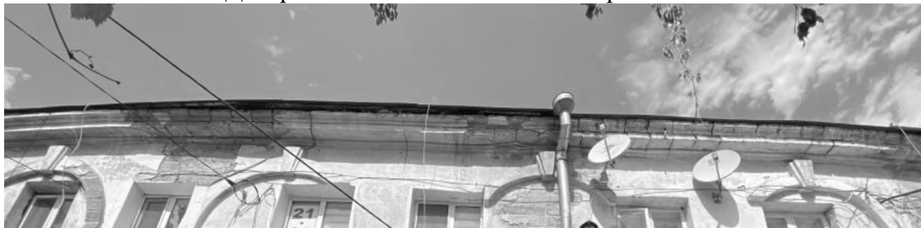
Декоративный элемент: венчающий карниз

- виды отделки поверхностей фасадов: фасады лит. «А» оштукатурены и окрашены водоэмульсионной краской, декоративные элементы, оштукатурены и окрашены водоэмульсионной краской;