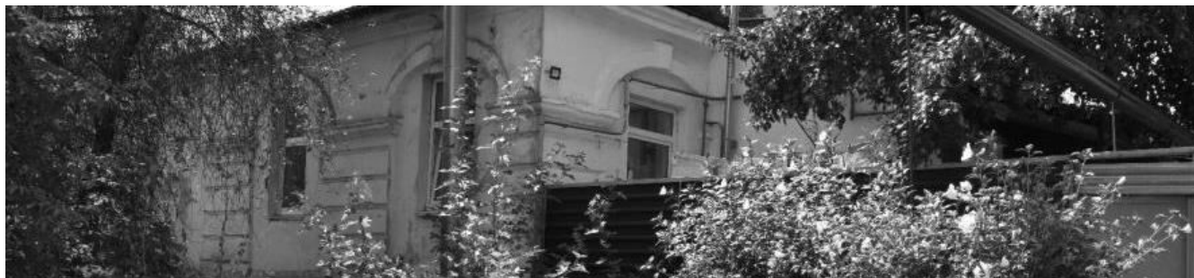
Декоративные элементы: слепые арки с замковым камнем