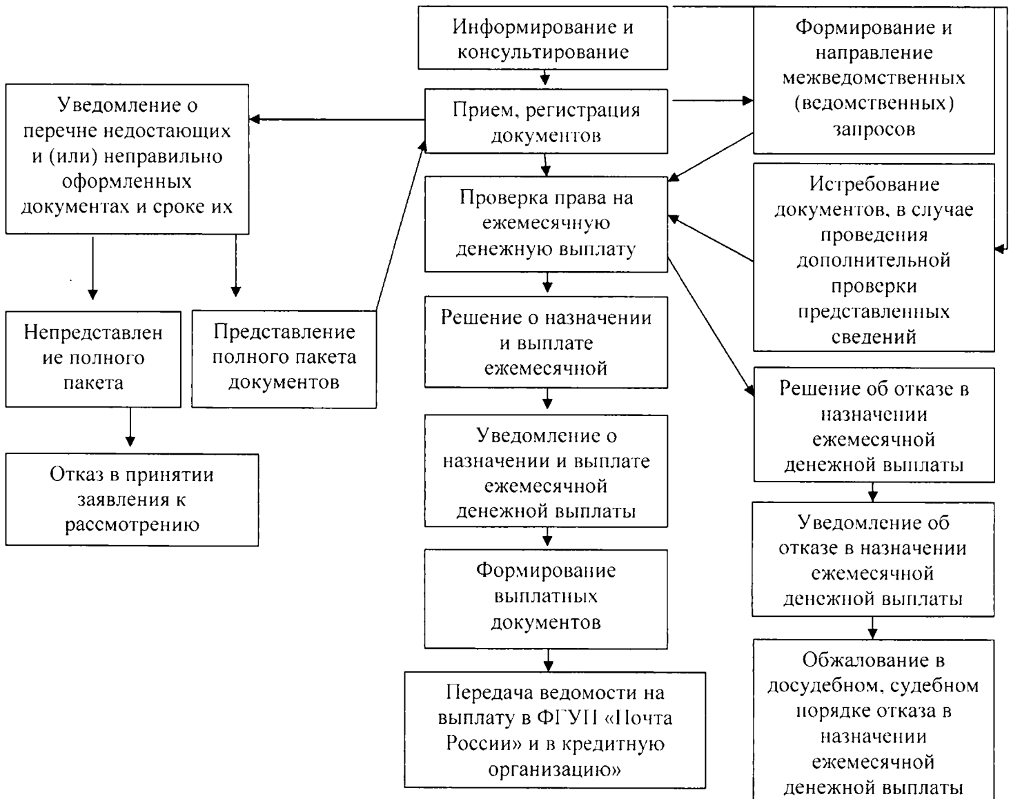
Блок-схема назначения и выплаты ежемесячной денежной выплаты

к типовому административному регламенту предоставления органом труда и социальной защиты населения администрации муниципального района (городского округа) Ставропольского края государственной услуги «Назначение и выплата ежемесячной денежной выплаты нуждающимся в поддержке семьям, назначаемой в случае рождения в них после 31 декабря 2012 года третьего ребенка или последующих детей до достижения ребенком возраста трех лет»